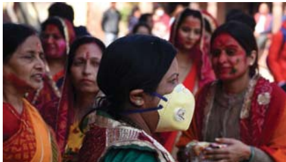
تصویر ۱۴: جشنواره آیین مذهبی - ملی هندوها در ایام کرونایی

بهار در هند و کشورهای آسیای جنوبی برگزار می‌شود [یهودیان هندی خارج از کشور نیز جشنواره را برپا می‌کنند]، نیز به دلیل شیوع گسترده و جهانی ویروس کرونا در اغلب کشورهای جهان لغو شده است...» (همان).