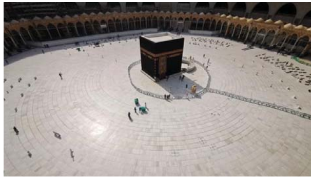
تصویر ۶: بیت الله الحرام (کعبه) در ایام کرونایی

در گزارش الجزیره، درباره نحوه تأثیر کرونا بر اجرای شعایر دینی در دو زیست جهان تسنن و تشیع بحث شده است که تمرکز آن به صورت تصویری و مستند بر تعطیلی «شعایر آیینی نماز و زیارت» در هر دو زیست جهان (آیین «حج» در مکه و زیارت مدینه در عربستان؛ «زیارت» عتبات عالیات در نجف، کربلا، کاظمین و سامرا در عراق و نیز حرم رضوی در ایران) است.