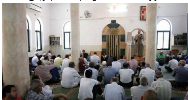
تصویر ۹: مسجدی در فلسطین (رام الله) در ایام کرونایی

- اعلام فتوای مجمع علمای مغرب (مراکش) مبنی بر لزوم «توقف نمازهای جمعه» و «بسته شدن مساجد» به لحاظ اهمیت شرعی حفظ حیات اجتماعی - سیاسی مسلمانان و بسته ماندن مساجد این کشور تا رفع کرونا (سایت وزاره الاوقاف و الشئون اسلامیه للملکه المغرب، الاربعاء ۱۸ مارس ۲۰۲۰). - دعوت وزارت امور دینی الجزایر از علمای دین برای روشنگری عالمانه و مطمئن نسبت به ضرورت شرعی «تعطیلی نمازهای جمعه» و «بسته شدن موقتی مساجد» برای حفظ سلامتی مسلمین و تداوم حیات اجتماعی سیاسی مردم الجزایر (سایت وزاره الشئون الدینیة و الاوقاف للملکه الجزایر، الثلاثاء - مارس ۲۴ - ۲۰۲۰). - فتوای مجمع علمی - دینی علمای اهل سنت درباره اهمیت شرعی «بسته شدن موقتی مساجد» و «تعطیلی اماکن عمومی» و «تعطیلی موقتی نمازهای جمعه» با هدف حفظ جان مسلمین (سایت وزاره الاوقاف و الشئون اسلامیه للملکه المغرب، الثلاثاء ۲۹ رجب ۱۴۴۱ هـ الموافق ۲۴ مارس ۲۰۲۰).