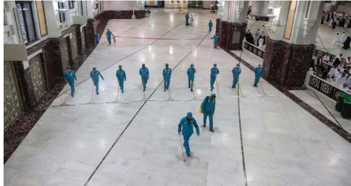
تصویر ۸: صحن حرم رضوی در ایام کرونایی (مشهد)