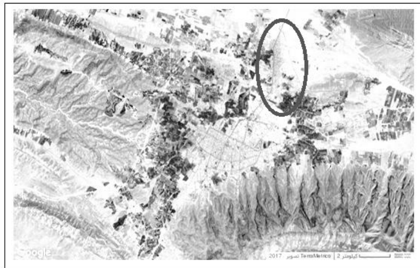
شکل شماره (۴): کاربری اراضی روستاهای ادغام شده در شهر