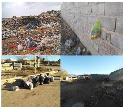
شکل ۲. وضعیت مدیریت زباله در سکونتگاه‌های مورد مطالعه