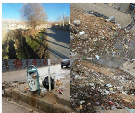
شکل ۳. وضعیت مدیریت زباله در سکونتگاه‌های مورد مطالعه

امروزه روستاهای موجود در پیرامون شهرها به واسطه جمعیت در حال افزایش جزء محدوده‌های بارز نمود چالش‌های محیط زیستی به شمار می‌روند که چشم‌انداز این مناطق را دستخوش