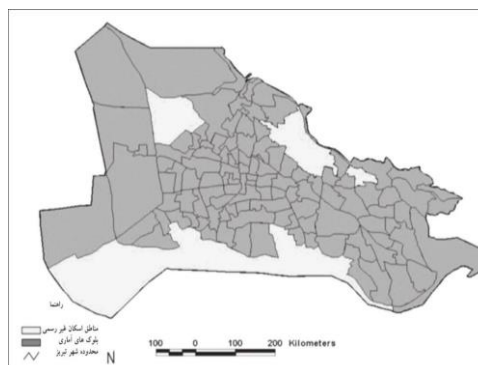
شکل ۱. نقشه محلات اسکان غیررسمی شهر تبریز

برای بررسی مسائل و مشکلات حاشیه‌نشینی، آسیب‌های اجتماعی و عوامل تأثیرگذار، شرایط مداخله‌گر و پیامدهای این تغییرات در محلات مورد بررسی در شهر تبریز و برای ایجاد درک عمیق‌تر نسبت به موضوع مورد بررسی، پی بردن به دیدگاه همه‌جانبه نسبت به موضوع و نیز برای برطرف نمودن ابهام بیان‌شده از روش نظریه بنیانی استفاده شده است (شکل ۲).