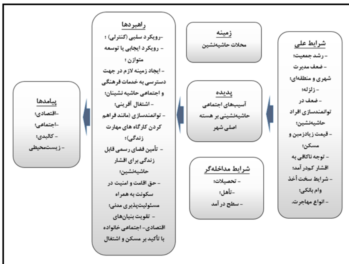
شکل ۲. مدل پارادایمی پدیده مسائل و مشکلات حاشیه‌نشینی، (مأخذ: یافته‌های تحقیق)

بر هسته اصلی شهر از روش نظریه مبانی استفاده شده است. از دید مصاحبه‌شوندگان، عوامل علی پدیده حاشیه‌نشینی، شرایط علی پس از اشباع به صورت جدول ۳ جمع‌آوری شده است: