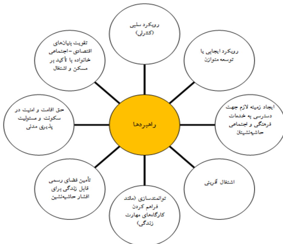
شکل ۳. راهبردهای حل مشکلات حاشیه‌نشین در محدوده مورد مطالعه

راهبردهای که برای حل مشکلات حاشیه‌نشین در محدوده مورد مطالعه شناسایی شده است عبارتند از: (۱) رویکرد سلبی (کنترلی)؛ (۲) رویکرد ایجابی یا توسعه متوازن؛ (۳) ایجاد زمینه لازم در جهت دسترسی به خدمات فرهنگی و اجتماعی حاشیه‌نشینان؛ (۴) اشتغال‌آفرینی؛ (۵) توانمندسازی (مانند فراهم کردن کارگاه‌های مهارت‌زندگی)؛ (۶) تأمین فضای رسمی قابل زندگی برای اقشار حاشیه‌نشین؛ (۷) حق اقامت و امنیت در سکونت به همراه مسئولیت‌پذیری مدنی؛ و (۸) تقویت بنیان‌های اقتصادی-اجتماعی خانواده با تأکید بر مسکن و اشتغال (شکل ۳).