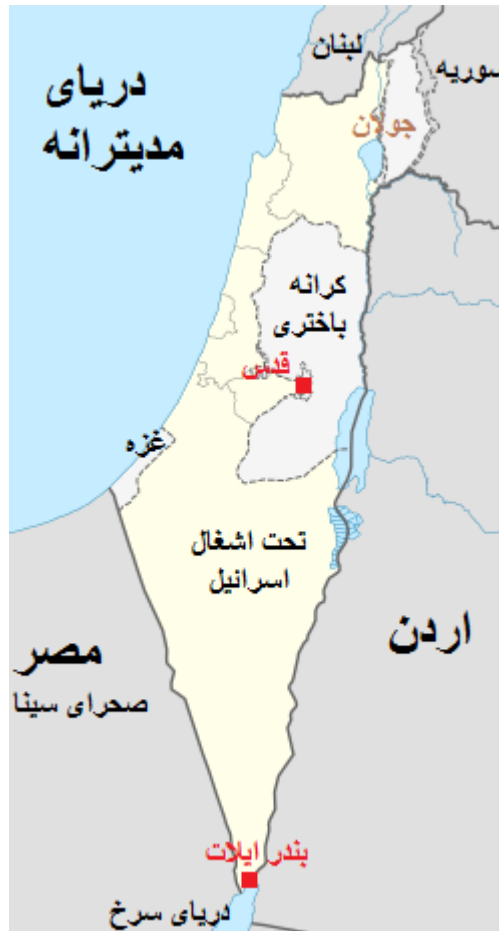
شکل ۲) موقعیت رژیم صهیونیستی

چالش داشته و در درون مرزهای این رژیم قرار دارند و همینطور مناطق اشغال شده توسط آن، بیشتر و مهم‌تر می‌گردد، چرا که این مناطق همگی در همجواری کشورهای همسایه این رژیم قرار دارند. تنها مزیت موقعیت ژئوپلیتیکی رژیم صهیونیستی را می‌توان دسترسی به آب‌های آزاد و همجواری با دریای مدیترانه و دریای سرخ دانست، که البته آن سوی این دریا و پیرامون آن نیز کشورهای مسلمان قرار دارند.