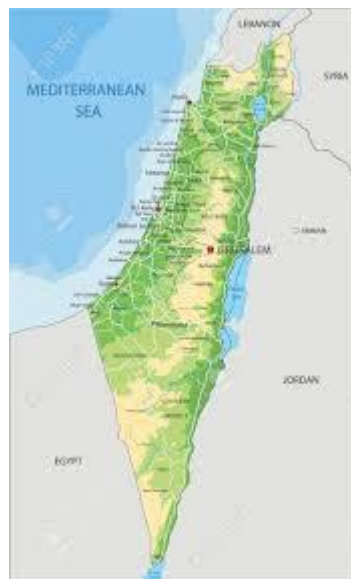
شکل ۳) نقشه طبیعی رژیم صهیونیستی

اما بلندی‌های دیگری که از ارتفاعات مرکزی اهمیت بسیار بیشتری دارند، بلندی‌های جولان می‌باشد. این بلندی‌ها که متعلق به سوریه بوده و توسط رژیم صهیونیستی اشغال شده است، به چند دلیل برای این رژیم اهمیت بسیار بالایی داشته و به همین دلیل رژیم صهیونیستی تمایل به اشغال آنها دارد. این بلندی‌ها به مثابه مرز و حفاظی طبیعی می‌باشد که بین این رژیم و سوریه می‌تواند حائل شود و تامین کننده امنیت این رژیم و به ویژه نیمه شمالی آن باشد. به علاوه تسلط به این ارتفاعات - به ویژه با توجه به فاصله کم این منطقه با دمشق - تسلط و برتری را بر سوریه به ارمغان می‌آورد. افزون بر این موارد، بلندی جولان یکی از مهم‌ترین مناطق تأمین کننده محصولات کشاورزی و غذایی و نیز آب مورد نیاز این رژیم می‌باشد. طبیعی است که تسلط بر این ارتفاعات برای دارنده آن برتری به ارمغان می‌آورد.