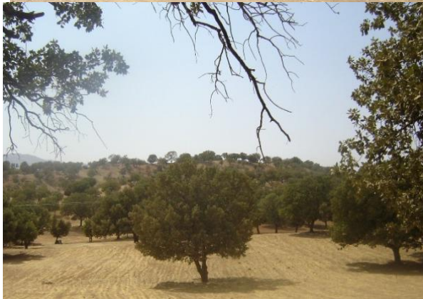
شکل ۲- نمایی از محل اجرای طرح مورد مطالعه بلوط