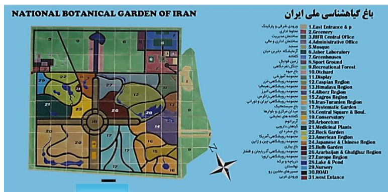
شکل ۱- نقشه باغ گیاه‌شناسی ملی ایران و جایگاه رویشگاه البرز (شماره ۱۴، بنفش رنگ).

از استقرار گیاهان، ریخت شناسی و چگونگی رفتار آن‌ها در رویشگاه جدید بررسی می‌شود. در نتیجه گونه‌هایی که به باغ انتقال یافته‌اند همیشه زیر نظر می‌باشند. از مهم‌ترین مجموعه‌های باغ می‌توان به بخش‌های ایران-تورانی، البرز، هیرکانی، زاگرس، باغ میوه، باغ سیستماتیک و نمایشی اشاره کرد (شکل ۱). با توجه به این که رویشگاه البرز جنوبی شامل منطقه تهران و اطراف آن می‌باشد، از این رو گونه‌هایی که در رویشگاه باغ گیاه شناسی سازگار شده اند و دارای ویژگی زینتی می‌باشند می‌توانند گزینه‌های خوبی برای کاشت در فضای سبز شهر تهران بدون آزمون و خطا باشند (شکل ۲). گونه‌های معرفی شده در این پژوهش از بین صدها گونه‌ای می‌باشند که با آزمون و خطا وارد رویشگاه شده و استقرار