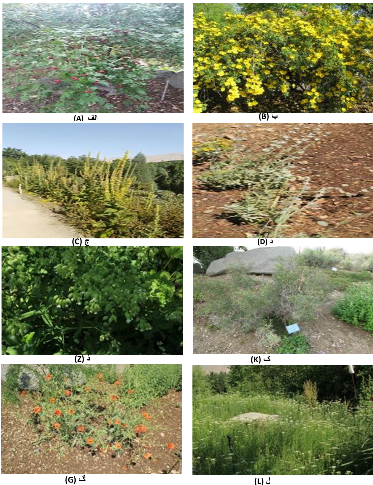
شکل ۴- الف: Crataegus astrosanguinea ، ب: Rosa foetida ، ج: Verbascum songaricum ، د: Stachys inflata ، ز: Silene vulgaris ، ک: Amygdalus scoparia ، گ: Glaucium elegans ، ل: Achillea millefolium .