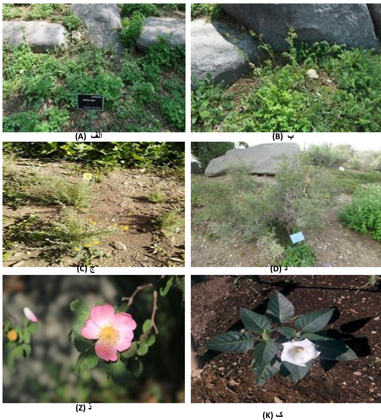
شکل ۵- الف: Ballota nigra ، ب: Sangisorba minor ، ج: Achillea vermicularis ، د: Amygdalus lycioides ، ز: Rosa canina ، ک: Daturea stramonium .