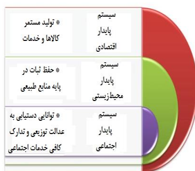
شکل ۱: سیستم پایدار

مفهوم اصل پایداری بین متخصصان مختلف، زمانی که آنها پایداری را تعریف می‌کنند، متفاوت است. محققان محیط‌زیست، پایداری را با تمرکز اصلی بر محیط‌زیست تعریف می‌کنند و اقتصاددانان، تمرکز خود را به بخش اقتصادی و غیره انتقال می‌دهند. با این حال، هر سیستم سه بُعد اقتصادی، اجتماعی و زیست‌محیطی دارد و تمام این سه مورد باید در توسعه پایدار مد نظر قرار گیرد. شکل ۱ انعکاس یک سیستم پایدار است که تمام این سه ستون، مفهوم اصلی پایداری را شکل می‌دهند و شکل ۲ ارتباط بین ابعاد پایداری را نشان می‌دهد که مبتنی بر قرارگیری سه بُعد تشکیل‌دهنده متحدالمرکز در درون یکدیگر است (طالب‌پور و داوری، ۱۳۹۸: ۲۷).