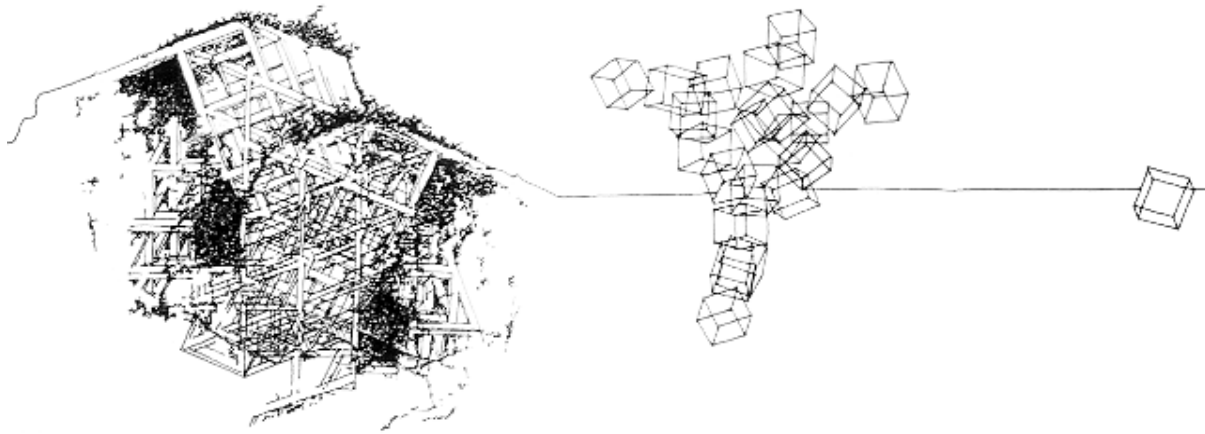
تصویر ۲: مطالعه لطیف عبدالملک بر روی شکستن سیال مکعب یا واسازی «کعبه» (Kahera 2002, 141)