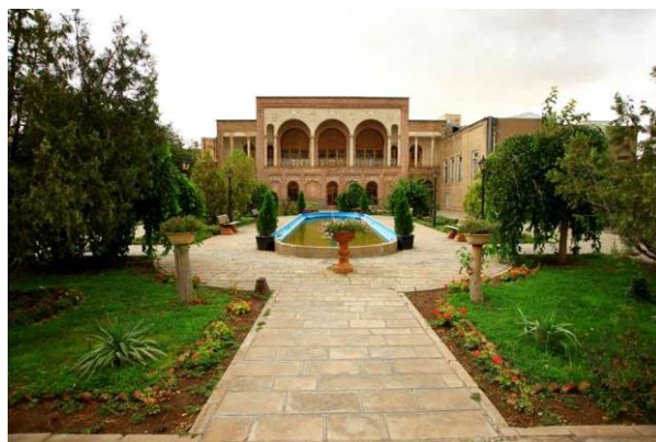
تصویر ۲: تصاویر ساختمان‌های بهنام و قدکی دانشکده معماری و شهرسازی دانشگاه هنر اسلامی تبریز (www.tabriziau.ac.ir)