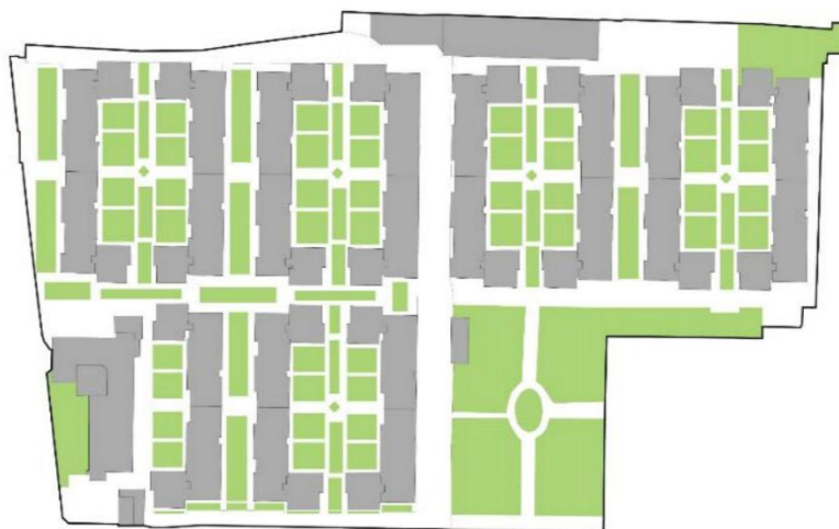
تصویر ۲: مجتمع چمران (نمونه ۱) Fig. 2: Chamran Complex (Sample 1)

(تصویر ۲) در قالب بلوک‌های سه تا پنج طبقه طراحی شده است، محصور است و ورودی و خروجی کنترل شده دارد. این مجموعه یک فضای سبز عمومی، زمین ورزش، تعداد ساختمان معدودی تجاری روزانه، و مسیر پیاده تعریف شده دارد و در عین حال چیدمان بلوک‌های آن به گونه‌ای است که حیاط‌هایی نیمه خصوصی بین آن‌ها ایجاد شده است. مساحت محدوده ۵۴۲۵۰ مترمربع است و ۳۳۱ واحد مسکونی در آن قرار دارد. ۶ رسالت، (تصویر ۳) منطقه‌ای مسکونی است که در آن آپارتمان‌های سه تا هشت طبقه در