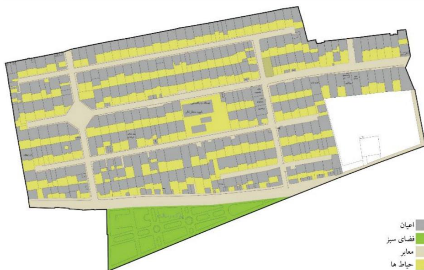
تصویر ۳: محدوده رسالت (نمونه ۲) Fig. 3: Resalat Restrict (Sample 2)

(ج) نمونه‌ها: از آنجا که تحقیقات (Koohsari et al. 2012; Wood 2006; Kang 2006) توصیه کرده‌اند که وضعیت اقتصادی اجتماعی نمونه‌ها (با توجه به تأثیر آن‌ها بر سرمایه اجتماعی) مشابه باشد، بنابراین تلاش شد تا نمونه‌های انتخابی نزدیک به یکدیگر و در یک ناحیه شهری باشند و در همان حال محیط کالبدی آن‌ها متفاوت باشد. بر این اساس مجتمع مسکونی شهید چمران و کوی برنجی (رسالت) ۹ در شهر تبریز که فاصله اندکی با یکدیگر دارند (۶۰۰ متر) به عنوان نمونه‌ها انتخاب شدند. مجتمع چمران