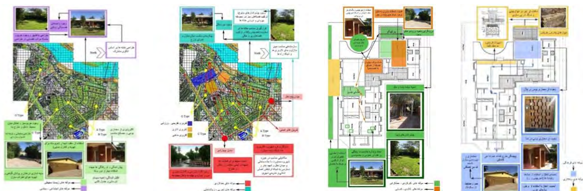
شکل ۱: مولفه‌های (درونی و بیرونی) در نیوسایت بر اساس مشاهدات میدانی

دلایل انتخاب نمونه‌های موردی تحقیق؛ نمونه فوق‌الذکر از میان نمونه‌های موفق شرکت شهرهای نفتی (نیوسایت) بر حسب پیشینه ساخت و نظام فکری و شکلگیری خاص خود نسبت به دیگر موارد اولویت تحقیق می‌یابد. همچنین به لحاظ وسعت و تنوع مسکن می‌تواند حاوی مضامین و مولفه‌های معماری و شهرسازی درخوری باشد که در سایر موارد مشابه قابلیت استفاده نیز داشته باشد. به عبارت دیگر به دلیل انطباق بیشتر این نمونه با نظام معماری و شهرسازی مذکور و به لحاظ امکان بهتر آزمون مبانی فکری پژوهش چه به لحاظ معماری و چه به لحاظ شهرسازی نمونه مذکور اولویت دارد. همچنین مفاهیم راهبردی تحقیق حاضر نمی‌تواند در سایر موارد در برخی به دلیل متصل شدن به بافت شهری پیرامون و در برخی دیگر به دلیل دوری از هسته مرکزی شهر به خوبی به بوت‌آزمایش قرار داده شوند. همچنین از نظر تنوع نمونه‌های معماری مسکن و ساختار هندسی و جانمایی شهری و رضایت نسبی ساکنین که مبنای دسته‌بندی‌های اصلی این پژوهش بوده است؛