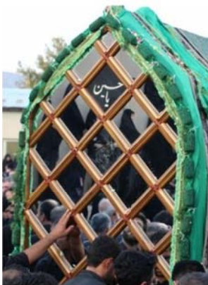
نخل جهادیه سمنان

پس از این، هنرمندان توانستند صفحه مشبک را به شکل‌های دیگر نیز عرضه کنند؛ از جمله صفحه مشبکی که حاصل کنار هم قرار گرفتن متوازی الاضلاع، مربع و یا مخلوطی از این دو باشد. نگارنده با جستجو در فضای مجازی توانستم به نخل‌های تابوت‌واره‌ای دست یابم که شکل‌های متفاوتی داشتند و در نقاط مختلف کشور از آنها استفاده می‌شود. شکل شماره ۴ نشان‌دهنده شماری از این تابوت‌واره‌هاست. تابوت‌واره‌های موجود در «تکیه جهادیه سمنان»، «مسجد جامع نطنز»، و بسیاری از نخل‌های استان یزد (و سایر نقاط کشور) به گونه‌ای طراحی و ساخته شده‌اند که در دو وجه مشبک آنها به ترتیب شکل‌های «لوزی»، «متوازی الاضلاع» و «مربع» مشاهده می‌شود. در «استهبان فارس» نخلی مشاهده شده که در دو وجه مشبک خود دارای ترکیبی از شکل‌های مربع و متوازی الاضلاع است (شکل ۴).