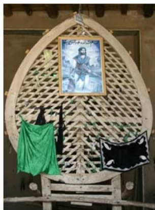
نخل مسجد جامع نطنز