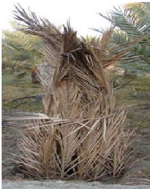
شکل ۲: نهال تازه کاشته شده نخل که توسط برگ‌های نخل مورد محافظت قرار گرفته است. لطفاً به شکل ظاهری آن با تابوت‌واره نخل توجه شود.

شده‌ای که برایش محافظ درست کرده‌اند، نشان داده شده است. دقت در شکل پاجوش کاشته شده‌ای که مورد محافظت قرار گرفته است با تابوت‌واره نخل مشابهت واضحی را به نمایش می‌گذارد.