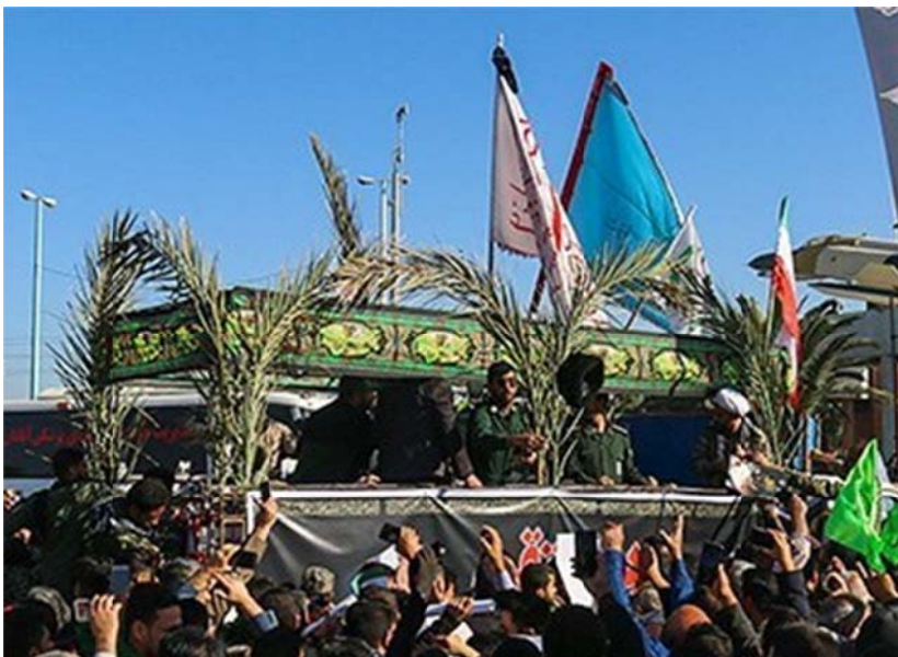
شکل ۱: تشییع پیکر شهید «ابومهدی المهندس» در آبادان. به ترتیب انجام شده توسط برگ‌های نخل توجّه شود.