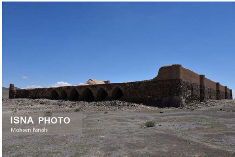
تصویر ۱: نمایی از کاروانسرا - قلعه خرگوشی ندوشن.