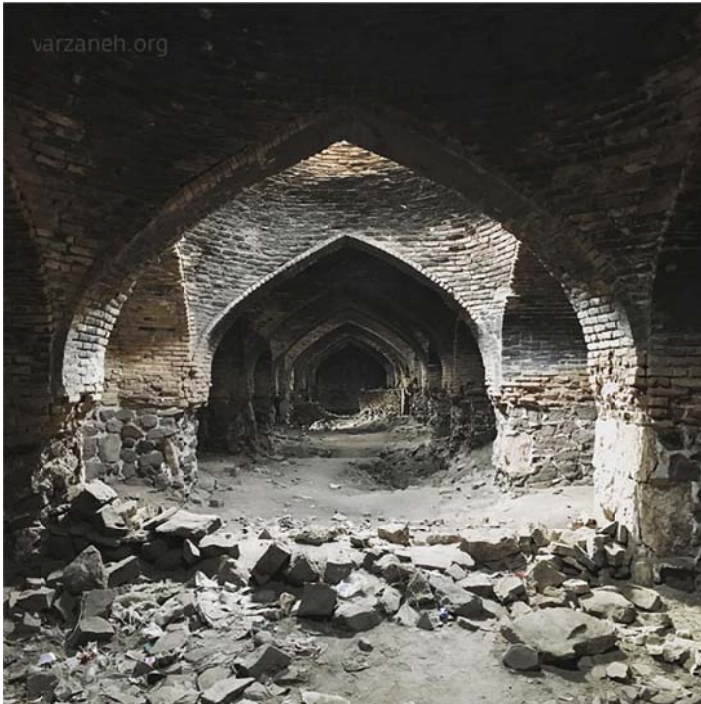
تصویر ۷: وضعیت دیوارهای درونی اتاق‌های کاروانسرا

است و در مکانی توسط سازمان میراث فرهنگی نگهداری می‌شود (به نقل از میرجانی (۱۶) در رستگار، ۱۳۹۹). به تازگی از سوی میراث فرهنگی اردکان اقدام به تعمیراتی در بخش‌های فرسوده بنا شده است که امید بهسازی این یادمان تاریخی و نگهداری بهتر آن را، با وجود کمبود بودجه لازم، زنده کرده است.