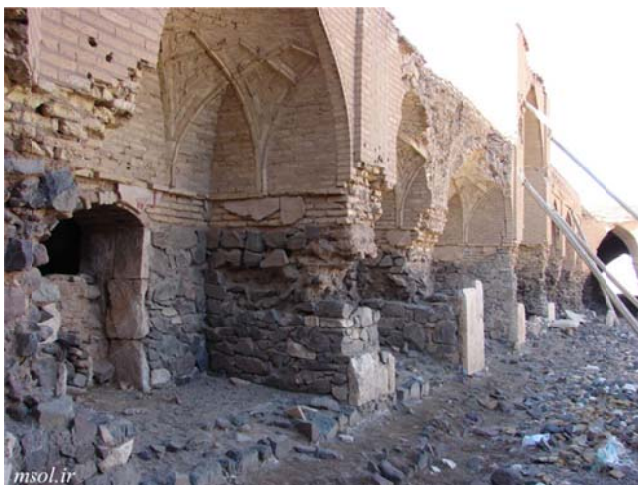
تصویر ۹: چهره بیرونی بنا و فروریختگی و جدایی قطعات سنگی و بخشی از آجرهای دیوار.

نخورده باقی مانده است. هم زمان آجرهای مربع شکل و تخت برای پوشش پشت بام به قلعه حمل می‌شود و زیباتر از همه ناودان‌های تراشی شده از سنگ سفیده ندوشن می‌باشد که بسیاری از آنها هنوز سالم و پا برجا مانده‌اند، ولی بعضی هم شوربختانه کنده شده و در اطرف قلعه بین سنگ‌های خراب شده افتاده است» (جعفری‌ندوشن، ۱۳۹۴: تصویر ۹).