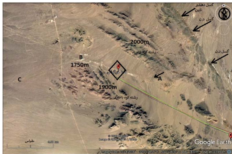
تصویر ۳: جایگاه کاروانسرا نسبت به گسل دهشیر - ناین، مابین دو رشته کوه و مسیر آبراهه اصلی از A به B و C.

جدا از فضای خود کاروانسرا، گستره‌های پیرامون آن، چه در کوه‌های جداگانه و چه در دشت یا آبرفت‌ها، دستبرد زده شده و به شدت در هم ریخته شده است که تصاویر ماهواره‌ای و عکس‌های هوایی این دگرگونی‌ها را به خوبی نشان می‌دهند.