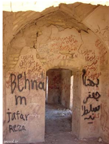
تصویر ۶: نمونه‌ای از وضعیت بنا و دیواره‌های داخلی آن (برگرفته از سایت msol.ir). عکس از کتابی، ۱۳۹۰

تاریخی است. نشانه‌ها و یادگارهای بازمانده در این بنا از ویرانی و فروپاشی