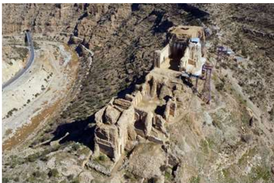
تصویر ۵- قلعه دختر ( https://tripyar.com/iran )

نیروهای دولت تازه تأسیس را در مقر دژ مستقر می‌کرده و در صورت حضور نیروهای ارتش امپراتوری اشکانی یا هر دشمن دیگر، تا راه را با دفاع عامل برای ورود آن‌ها به دشت ببندند. ارتفاع بالاتر دژ از سطح دره، امتیاز برتری را به نیروهای ساسانی می‌داده و چه‌بسا با نیروهای کمتر نسبت به دشمن می‌توانستند به پیروزی رسیده و مانع ورود دشمن به دشت و شهر اردشیر خوره شوند (تصویر -۵).