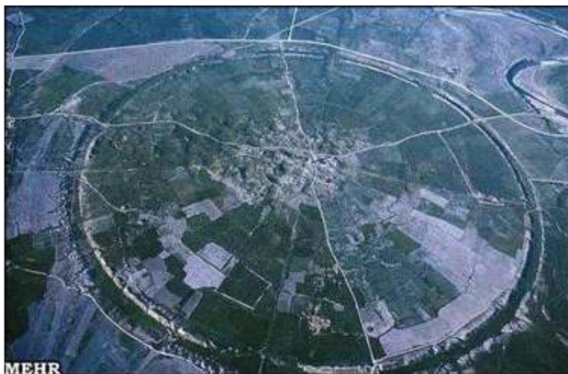
تصویر شماره ۲- شهر اردشیر خوره (مهر آفرین، ۱۳۹۳: ۲۰۱)

چنانکه ملاحظه می‌گردد، قلمرو دایره‌ای شکل شهر با قلمرو سایر شهرهای این دوره مشابهت دارد. ایجاد این نوع قلمرو به ساسانیان کمک می‌کرده است که بتوانند امنیت شهرهای خود را بهتر کنترل نمایند (تصویر-۲).