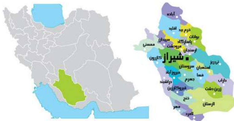
تصویر ۱- موقعیت شهرستان‌های فیروزآباد در استان فارس (صالحی، ۱۳۹۷: ۶۴)

چنانکه ملاحظه می‌گردد، قلمرو دایره‌ای شکل شهر با قلمرو سایر شهرهای این دوره مشابهت دارد. ایجاد این نوع قلمرو به ساسانیان کمک می‌کرده است که بتوانند امنیت شهرهای خود را بهتر کنترل نمایند (تصویر-۲).