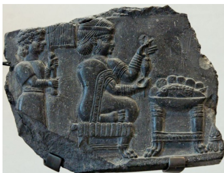
۲- بانوی ریسنده دوره جدید؛ موزه لوور

در دوره ایلام میانه نقش زنان همچنان در میان آثار آن دوره وجود دارد. نقش برجسته خدا بانو و گاومردی که به درخت نخل تکیه داده و به همراه کتیبه ایلامی از مجموعه آجرهای تزیینی معبد خدای اینشوشیناک شوش بدست آمده و قدمت آن ۱۲۰۰ ق م است. «محمد پناه؛ ۱۳۸۶؛ ۴۰ - ۲۹» همچنین الهه های باروری و نماد های زنانگی در هزاره دوم ق م در دوره میانه ایلام باز هم دیده می شود. از دوره ایلام جدید به تدریج حضور ایزدان مذکر بیشتر می شود و کم کم حضور زنان و الهه گان محدودتر می شود. بر روی نقش برجسته ایلامی دیگری زنی اشرافی در حال نخ ریزی؛ متعلق به سده ۹ ق م است که موهای خود را به سبک آرایش زمانه خود با نوارهای تزیینی آراسته است. به نظر می رسد پوشاندن مو و داشتن پوششی که از سر تا پا را فراگیرد؛ چندان در میان زنان ایلامی متداول نبوده است.