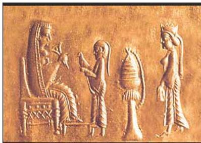
۶- مهر هخامنشی؛ موزه لوور

در تصاویری که از بانوان سلطنتی هخامنشی و ملازمان آنان در مجموعه پازریک کشف شده است نیز استفاده از این چنین پوشش چادر مانند دیده می شود که تاجی را نیز بر آن نهاده اند. همچنین در مهر بسیار ظریفی که در موزه لوور موجود است ملکه ای بالباس و چادر هخامنشی و تاج بر مسند شاهانه تکیه زده و در مقابل او ندیمه ای بدون کلاه با موهای بافته ایستاده است. این چنین به نظر می رسد که داشتن چادر نوعی تشخیص در میان زنان درباری محسوب می شده است.