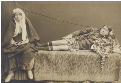
۱۳- تضاد سنت و مدرنیته در دوره ناصرالدین شاه

رنگ های آبی؛ قهوه ای و سفید به عرض دو انگشت در اطراف چادر مشکی معمول گردید. سابقاً جلو چادر مشکی را بندی می دوختند که هنگام سر کردن چادر آن را به گردن می انداختند ولی بعد ها بند را به قسمت جلو چادر دوخته و دوسر آن را آزاد می گذاشتند که هنگام سر کردن آن را در پشت کمر محکم می کردند. چادر های عبایی که از بغداد آورده می شد بسیار گرانبها و مخصوص زنان اعیان و اشراف بود. (ذکاء؛ ۱۳۳۶: ۳۱)