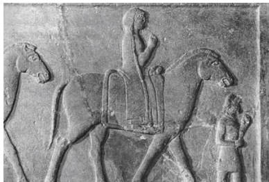
۳- نقش برجسته زن با چادر موزه تاریخ باستان استانبول

نمونه های پراکنده ای از پوشش زنان در آثار هخامنشیان وجود دارد که نشان می دهد لباس آنان شباهتی به لباس زنان ایلامی ندارد. در بررسی آثار هخامنشیان به نکته قابل توجهی پی می بریم و آن پوشاندن سر و استفاده از چادر به منظور پوشاندن کامل اندام است. پوشش زنان سر تا پای آنان را در بر می گرفت و مردان برای پوشاندن سر از کلاه استفاده می کردند. « یک نمونه از پوشش زنان در آسیای صغیر در هنگام کشف یک نقش برجسته در حوالی داسیلیون ارگیلی پایتخت قدیمی ساتراپی فریجیه متعلق به هخامنشیان؛ پدیدار شد. این نقش برجسته بقایای دسته ای از ملتزمان رکاب وزنان و مردانی بر پشت قاطرهاست. این نقش در حال حاضر در موزه استانبول در ترکیه نگهداری می شود. این قطعه باقیمانده؛ زنی را بر پشت یک قاطر نشان می دهد که دارای یک چادر بلند است.» (پور بهمن؛ ۱۳۸۶: ۷۶)