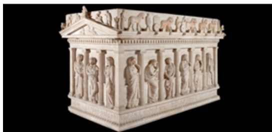
۴- تابوت سنگی موزه تاریخ باستان استانبول

در تصاویری که از بانوان سلطنتی هخامنشی و ملازمان آنان در مجموعه پازریک کشف شده است نیز استفاده از این چنین پوشش چادر مانند دیده می شود که تاجی را نیز بر آن نهاده اند. همچنین در مهر بسیار ظریفی که در موزه لوور موجود است ملکه ای بالباس و چادر هخامنشی و تاج بر مسند شاهانه تکیه زده و در مقابل او ندیمه ای بدون کلاه با موهای بافته ایستاده است. این چنین به نظر می رسد که داشتن چادر نوعی تشخیص در میان زنان درباری محسوب می شده است.