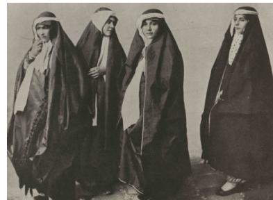
۱۲- چادر عبایی

در ابتدای حکومت ناصرالدین شاه طبق اظهارات دکتر ویلز زنان چادری آبی و یک تکه بر سر می کردند و روبندی صورتشان را می پوشانده است. خانم کارلاسرنا رنگ چادر زنان را سرمه ای تیره می داند. هانری بایندر در اواخر حکومت ناصرالدین شاه به ایران آمده بود. وی در مورد چاقچوری که زنان در خارج از خانه می پوشیدند می گوید: «زنها در کوچه شلواری گشاد که تمام شلیته ها را داخل آن می کنند؛ می پوشند. این شلوار انتهایش به جورابی دوخته شده که داخل کفش می شود. بر روی سر چادری از جنس پنبه ای به رنگ آبی و بر روی چادر روبندهای سفید که در مقابل چشمانشان شبکه ای به شکل ابریشم دوزی تعبیه شده است.» (بایندر؛ ۱۳۷۰: ۱۱۳) تا اواسط دوران سلطنت ناصرالدین شاه استفاده از چادری به رنگ آبی تیره مورد استفاده زنان بود و در میان زنان متوسط و پایین جامعه آن روزگار؛ پارچه چادر از کرباسی بود که آن را با نیل به رنگ آبی در آورده بودند.