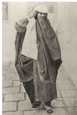
۱۱- چادر نواردوزی شده

در زمان آقا محمد خان قاجار و فتحعلیشاه زنان همچنان از چادر سفید و بر روی آن از روبنده استفاده می‌کردند. دروویل؛ چادر زنان ایرانی در زمان فتحعلی شاه را چنین توصیف می‌کند. «زنان به هنگام خروج از خانه خود را در چادری از قماش نخی سفید دوخته شده که دامن آن گرد است می‌پوشانند. با قیطانی چادر را بر سر و یا گردن محکم کرده و صورت خود را با پارچه‌ای به نام روبند می‌پوشانند. روبند پارچه نخی چهارگوشی است که با دو قلاب کوچک در بالای پیشانی به دستار می‌چسبند. در میان روبند شکاف درازی باز کرده و آن را توردوزی می‌کنند. زنان هنگام خروج از خانه چکمه‌های پارچه‌ای بلندی که تا بالای زانومی رسد به پا می‌کنند. شلوار آنها نیز درون این چکمه‌های پارچه‌ای قرار می‌گیرد.» (شریعت پناهی؛ ۱۳۷۲: ۸۶) منظور دروویل از چکمه پارچه‌ای همان چاقچور است. چاقچور شلوارگشادی بود که جوراب دوخته شده‌ای به آن متصل می‌شد و به وسیله بند جوراب دور پا نگه داشته می‌شد. چاقچور قسمت دوم حجاب بیرونی زنان به شمار می‌رفت. «رنگ چاقچور را بنفش و آبی تند و سینه‌کفتری انتخاب می‌کردند و زنان سیده چاقچور سبز می‌پوشیدند. ولی چاقچور سیاه در بین بانوان مجلل‌تر و متین‌تر محسوب می‌شد و گاهی آن را از خارا ۴ و قنایز ۵ و مخمل می‌دوختند.» (ذکاء؛ ۱۳۳۶: ۳۲) استفاده از چاقچور از زمان آقا محمد خان قاجار در میان زنان متداول شد و تا اواخر سلطنت ناصرالدین شاه ادامه پیدا کرد. در همان اواخر سلطنت ناصرالدین شاه است که خانم کارلاسرنا از چاقچورهایی از چلوار سبز؛ بنفش و خاکستری و قرمز نیز نام می‌برد؛ که در بین زنان رایج بوده است.