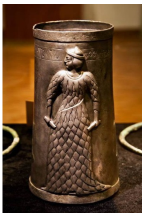
۱- جام مرو دشت؛ دوره کهن موزه ایران باستان

در دوره ایلام میانه نقش زنان همچنان در میان آثار آن دوره وجود دارد. نقش برجسته خدا بانو و گاومردی که به درخت نخل تکیه داده و به همراه کتیبه ایلامی از مجموعه آجرهای تزیینی معبد خدای اینشوشیناک شوش بدست آمده و قدمت آن ۱۲۰۰ ق م است. «محمد پناه؛ ۱۳۸۶؛ ۴۰ - ۲۹» همچنین الهه های باروری و نماد های زنانگی در هزاره دوم ق م در دوره میانه ایلام باز هم دیده می شود. از دوره ایلام جدید به تدریج حضور ایزدان مذکر بیشتر می شود و کم کم حضور زنان و الهه گان محدودتر می شود. بر روی نقش برجسته ایلامی دیگری زنی اشرافی در حال نخ ریزی؛ متعلق به سده ۹ ق م است که موهای خود را به سبک آرایش زمانه خود با نوارهای تزیینی آراسته است. به نظر می رسد پوشاندن مو و داشتن پوششی که از سر تا پا را فراگیرد؛ چندان در میان زنان ایلامی متداول نبوده است.