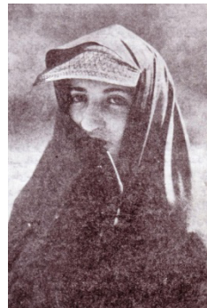
۱۴- چادر و پیچه در دوره مشروطیت