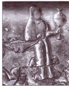
۸- نقش زن بر روی ظرف نقره دوره ساسانی

دردوران ساسانی عناصر اصلی تن پوشها همان است که در زمان اشکانیان متداول بوده است. در آثار این دوره بیشتر به پارچه ها و نقوش آنها پرداخته شده تا جزییات لباس. «زنان تن پوش بلند با آستین و یا بدون آستین بر تن داند و حجایی نیز که بر شانه چپ حائل شده آن را تکمیل کرده است.» (بوسایلی؛ ۱۳۷۶: ۸۲) چادر برای زنان ساسانی از عناصر مهم پوشش تن و سر بوده است که به صورت گوناگون آن را مورد استفاده قرار می دادند و گاهی به دور کمر می بستند. می شود اینطور نیز قضاوت نمود که چادر در میان زنان این دوره کاربردهای زیبا شناسانه ای نیز داشته است.