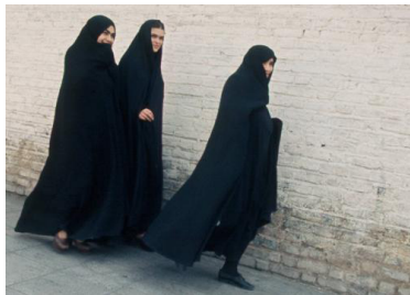
۱۵- چادر امروز