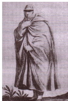
۹- زن ایرانی از سفرنامه تاورنیه

سیاح دیگر تاورنیه بود که در فاصله زمانی حکومت شاه صفی تا شاه سلیمان در ایران به سر می برده است؛ او در مورد حجاب زنان باز هم به حجاب بلند سفیدی به نام چادر اشاره می کند که روی همه ملبوسات خود می پوشند و از سر تا پا بدن و صورتشان را مستور می کند و دستمالی بر صورت می نهند که در مقابل چشمانشان شبکه توری تعبیه شده است. شاردن فرانسوی هم از چادر سفیدی نام می برد که زنان هنگام بیرون رفتن از خانه از آن استفاده می کنند. روبنده سفید یا نقابی سیاه بافته شده از موی اسب هم بر روی چادر بر سر نهاده می شد. اینگونه استفاده از چادر سفید همچنان در زمان کریم خان زند نیز معمول بوده است. به نقل از یحیی ذکاء در دوره زند است که به جز چادر سفید «زنان چادرسیاه یا بنفش یا نیلی تند به سر می کردند و روی خود را محکم می گرفتند.» (ذکاء؛ ۱۳۳۶: ۱۲)