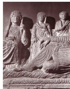
۷- پیکره های تدفینی پالمیرا؛ موزه دمشق