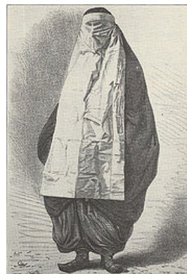
۱۰- چاقچور و روبند

بر طبق نوشته‌های اولیویه زنان عادی که زندگی خالی از تکلفی داشته‌اند؛ از چادرهای تنگ کرباس راه راه آبی سفید استفاده می‌کردند که با یک دست آن را جمع و بادیست دیگر صورت خود را می‌پوشانند. در دوره محمد شاه تغییراتی در لباس ایرانیان پیدا شد اما زنان دیگر از چادرهای سفید در خارج از خانه استفاده نمی‌کردند؛ چادرها به رنگهای سیاه یا بنفش بود اما روبند سفید برای پوشانده صورت مانند گذشته همچنان معمول بود. «به طور کلی پوشش اصلی زنان دوره اول و دوم قاجاریه در خارج از خانه چادر سفید بود و انواع گوناگون داشت که عبارت بود از چادر نماز چیت؛ کرباس؛ مخمل و اطلس و یا چادر کرباس چهارخانه که به رنگ‌های آبی و قهوه‌ای که آن را چادر شب هم می‌گفتند.» (غیبی؛ ۱۳۸۴: ۵۹۸) چادر شب در روستاها به کار برده می‌شد و آن را به شکل مربع می‌بریدند و روی سر قرار می‌دادند و روبند را به آن می‌بستند. اینگونه چادرشبها همچنان در میان زنان اقوام ایرانی مرسوم است. «چادر سیاه یا بنفش ریشه دار پنبه‌ای یا ابریشمی که در یزد بافته می‌شد بسیار با دوام بود. زنان اعیان و بزرگان اطراف این چادرهای سیاه را با گلابتون دوزی و حاشیه نقره‌ای تزیین می‌کردند. بعدها این کار منسوخ شد و به جای آن حاشیه سر خود به