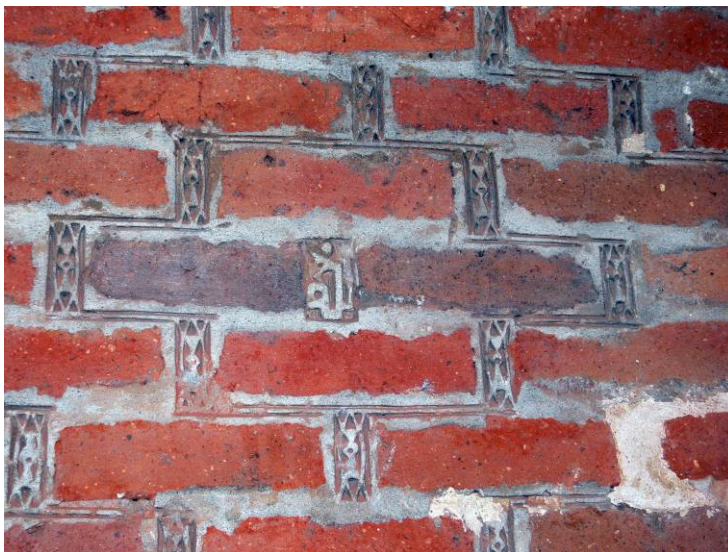
تصویر شماره ۷- کلمه الله به خط کوفی تزئینی در میان بندکشی آجری

نه- آخرین نمونه که متعلق به اولین سال‌های قرن هفتم هجری است و به دلیل محدود بودن نمونه‌ها با اغماض از فاصله ۲ ساله با مقطع زمانی مورد بحث معرفی می‌شود؛ سنگ مزاری است از جنس سنگ سیاه مربوط به گورستان روستای لیوان، با خط نسخ و به زبان عربی و متعلق به سال ۶۰۲ هـ ق متن سنگ‌نوشته چنین است: «الله / کل من علیها فان / هذا القبر رحمه الله ... ابن محمد / المحتاج الی رحمه الله تعالی / فی شهر شعبان سنه اثنی ست مایه»