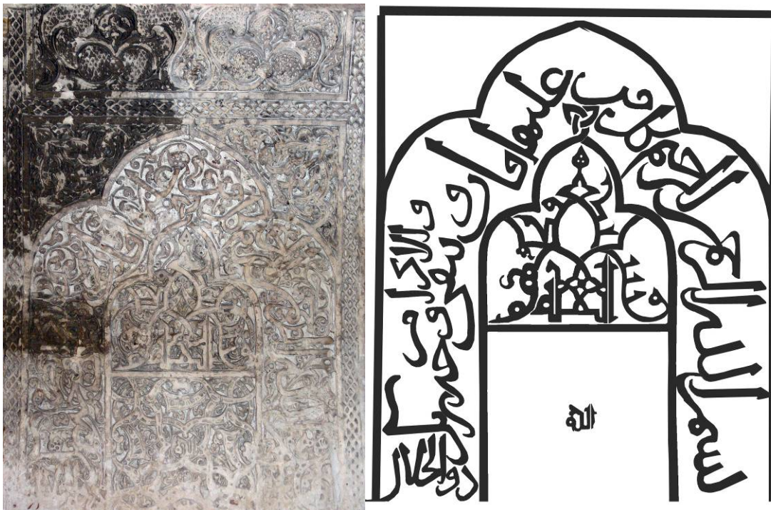
تصویر شماره ۶- طرح کتیبه سرداب گنبد کبود (عکس و طرح از نگارنده)

با ویژگی تزئینات ایلخانی بیش‌تر هماهنگی دارد تا با آجرکاری و سبک تزئینات بیرونی بنا. این کتیبه یکی از زیباترین نمونه‌ها در نوع خود است که نگارنده در هیچ منبع مکتوبی بازخوانی کامل و صحیح و ارائه طرح آن را مشاهده نکرده است. صرفاً آندره گدار در کتاب آثار/ ایران اشاره مختصری به این کتیبه دارد. متن صحیح و کامل کتیبه از این قرار است: «بسم الله الرحمن الرحيم / کل من علیها فان و یبقی وجه ربک ذوالجلال و الاکرام» (تصویر شماره شش) و نیز در داخل شکل محرابی در مرکز کتیبه مذکور این نوشته وجود دارد: «فسیکفیهم الله» که با یک ترکیب بدیع و به خط کوفی نوشته شده است. عبارت مذکور به عنوان طولانی‌ترین عبارت قرآنی معروف است. در قسمت پایین این نوشته در داخل یک کادر مربع شکل نقوش تزئینی زیبایی گچبری شده که واژه الله را در بر گرفته‌اند. کلمه الله به خط کوفی تزئینی است و مکرراً در بندکشی گچی لابلای آجرهای دیواره سرداب تکرار شده، برای تزئین بندکشی‌ها غیر از این واژه از یک شکل نمادین دیگر استفاده شده است. (تصویر شماره هفت)