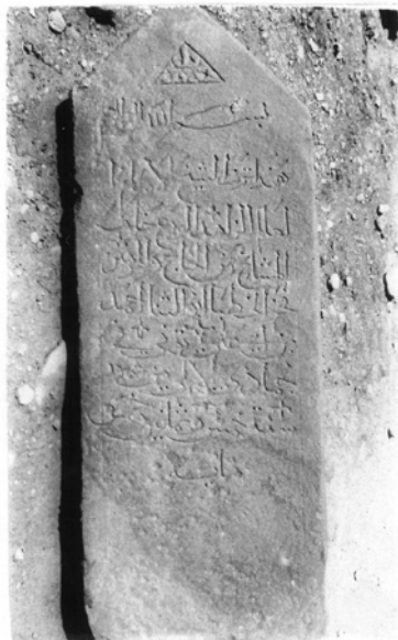
تصویر شماره ۳- سنگ مزار از گورستان پینه شلووار