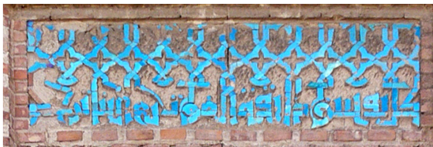
تصویر شماره ۹- کتیبه سردر گنبد مدور

در نهایت، نگارنده در بازدید از بنا متوجه گردید که برج مدور مرمت شده و شکاف ترک آن نیز پر شده است. شواهد حاکی از آن است که سعی شده جمله پیشنهادی گذار، الگوی مرمت کتیبه قرار گیرد. اما قطعاتی از آجر لعاب‌دار کتیبه، اضافه باقی مانده است. و خلوتی ناموزون انتهای کتیبه نیز مشهود است. (تصویر شماره نه) نکته دیگر عدم مطابقت همان بخش از طرح گذار با وضعیت اصلی کتیبه است به طوری که در طرح مقداری از تزئینات حذف شده و کتیبه کوتاه‌تر تصویر شده است. این نکته با مقایسه تصاویر هشت و نه آشکارتر می‌گردد.