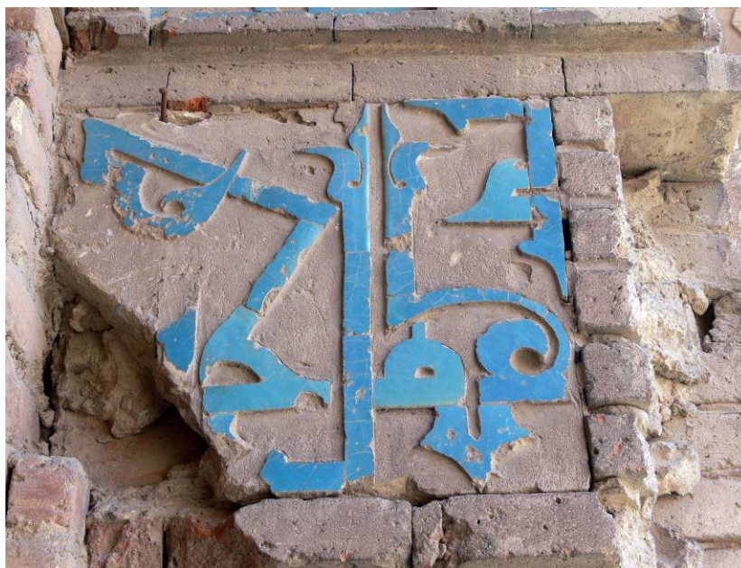
تصویر شماره ۵- بخشی از کتیبه سردر گنبد کبود

در سرداب یا زیرزمین همین بنا نیز کتیبه‌ای به خط ریحان وجود دارد. این کتیبه به شکل گچبری شده است و کتابت آن بایستی متعلق به دوره‌ای بعد از تاریخ ساخت خود بنا باشد چرا که سبک گچبری آن