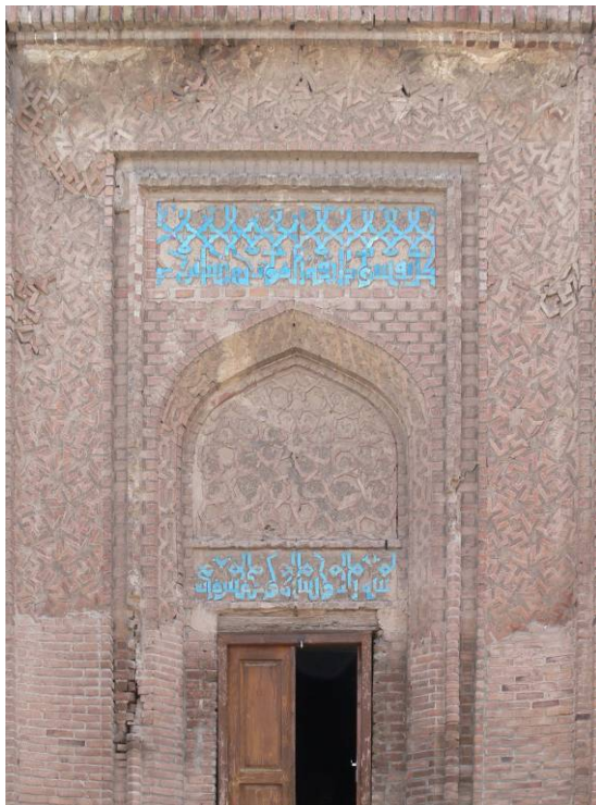
تصویر شماره ۲- گنبد مدور مراغه

به زبان عربی است. متن آن چنین است: «بسم الله الرحمن الرحيم/ هذا تربت الشيخ الامام العالم الزاهد الورع/ خلف المشايخ زين الحاج الحرمین/ فخر الخطبا ابوالثنا احمد بن ابی علی توفی فی جمادی الاولی من شهر سنه خمس و ثمانین و خمس مایه» (تصویر شماره سه)