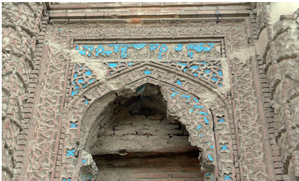
تصویر شماره ۴- کتیبه سردر گنبد کبود (عکس از نگارنده)

وسازنده بنا را معرفی کرده است که متأسفانه در اثر الحاقات بعدی از بین رفته و فقط ابتدای کتیبه یعنی کلمه «عمل» خوانده می‌شود. (تصویر شماره پنج) پلان گنبد کبود ده ضلعی منتظم است و در همه اضلاع بیرونی آن کتیبه‌های کوفی با آجر لعاب‌دار و با موضوع آیات قرآن وجود دارد. بر روی سطح دیوار داخلی گنبد نیز نوشته‌ای به شکل گچبری و به خط ریحان به چشم می‌خورد که دور تا دور دیواره بنا را پوشانده است. این کتیبه که بسیار تخریب‌شده آیاتی از قرآن مجید را داراست.