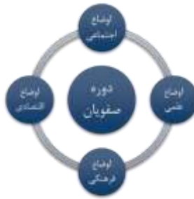
شکل ۱: توضیحات ضروری در این بحث

برای تهیه نقشه ذهنی باید بر روی تابلوی آموزشی، عنوان جلسه در مرکز نوشته شود و سپس زیرمجموعه‌هایی از عناوین یا سؤالات، پیرامون آن یادداشت شود. سپس هر گروه در مورد هر شاخه توضیحات خود را ارائه می‌دهند و نکات مهم هر شاخه را در کنارش یادداشت می‌کنند.