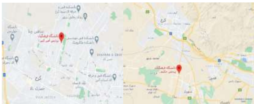
شکل ۱: موقعیت جغرافیایی دو پردیس در شهرستان کرج

دانشگاه فرهنگیان استان البرز در دو پردیس حکیم فردوسی برادران و امیرکبیر خواهران از سال ۱۳۹۱ به طور مستمر در حوزه آموزش جغرافیا و جذب و تربیت دانشجومعلم اهتمام دارد. از این رو از سال ۱۳۹۱ تا ۱۳۹۹ دانشجومعلمان علاقه‌مند، در دو پردیس به صورت جداگانه مورد پذیرش واقع شده و آموزش‌های لازم توسط گروه علوم انسانی و اجتماعی به آن‌ها ارائه گردیده است. پردیس برادران در جاده ملارد و پردیس امیرکبیر در بلوار باغستان کرج واقع شده‌اند که ۳۶ استاد تخصصی در گرایش‌های مختلف جغرافیا و وظیفه آموزش را در آن‌ها بر عهده دارند.