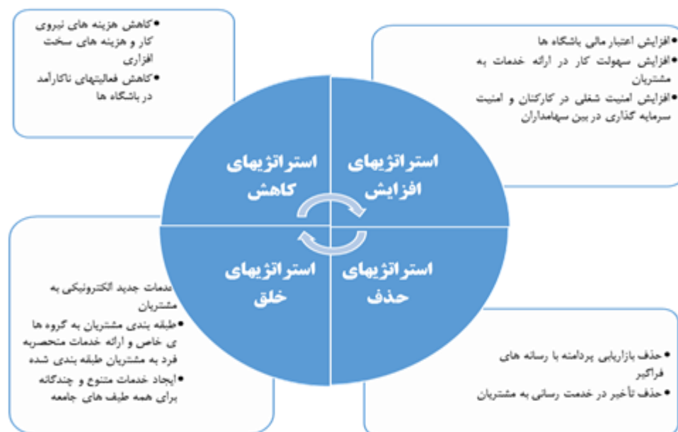
شکل ۲. استراتژی‌های اقیانوس آبی باشگاه‌ها

الگوی نهایی به دست آمده را که باشگاه‌های ورزشی برای پیشرو بودن به آن نیاز دارند را می‌توان در قالب شکل (۲) نشان داد. نتایج حاکی از این است که برای پیشرو بودن در صنعت ورزش بخصوص در حوزه باشگاه‌داری، باید راهبرد اقیانوس آبی در چهار اقدام اجرا شود.