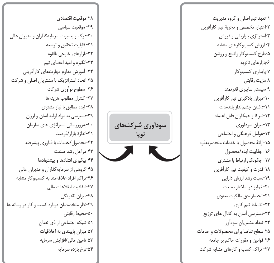
شکل ۱. مدل مفهومی احصاشده از ادبیات پژوهش

سیئونگ و کیم (۲۰۲۱) در تحقیق خود به بررسی عوامل حیاتی مؤثر بر سرمایه‌گذاری‌های سرمایه‌گذار خطرپذیر و تصمیم در مورد شرکت‌های نوپای نوآورانه که در سودآوری موفق عمل کردند، می‌پردازد. وی این عوامل حیاتی را به صورت زیر طبقه‌بندی کرده است: الف- کارآفرین شامل زیرمجموعه مدیریت/توانایی عملکرد، تجربه و تخصص/حرفه‌ای بودن، وضعیت کارآفرین، قابلیت اطمینان، ب- محصول/خدمات شامل: مزیت فنی، نوآوری، ارزش کالا و همبستگی یا بخش سرمایه‌گذاری شده، ج- بازار شامل: تهدید رقیب، توجه به قوانین و مقررات، اندازه بازار، رشد بازار و امکان ایجاد بازارهای جدید، د- بخش مالی شامل زیرمجموعه ارزش شرکتی، میزان