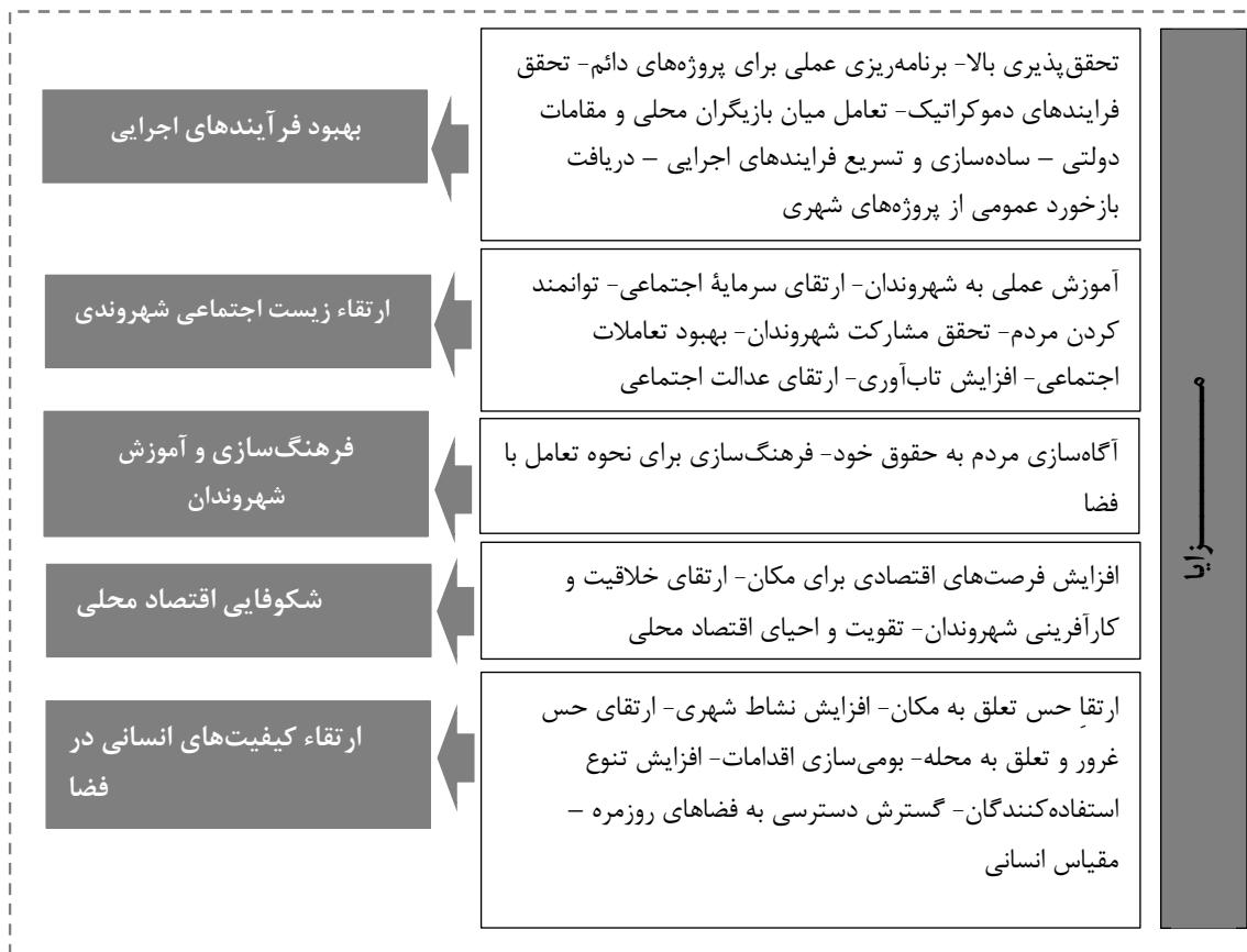
تصویر شماره ۳- خلاصه کدها و تم های حاصل از تحلیل محتوا در مقوله «چرایی» شهرسازی تاکتیکی