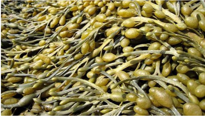
شکل ۱. گونه Ascophyllum nodosum