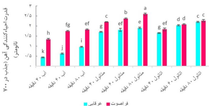
شکل ۵. اثر نوع حلال، زمان و روش استخراج بر قدرت احیاءکنندگی آهن عصاره پوست بادمجان