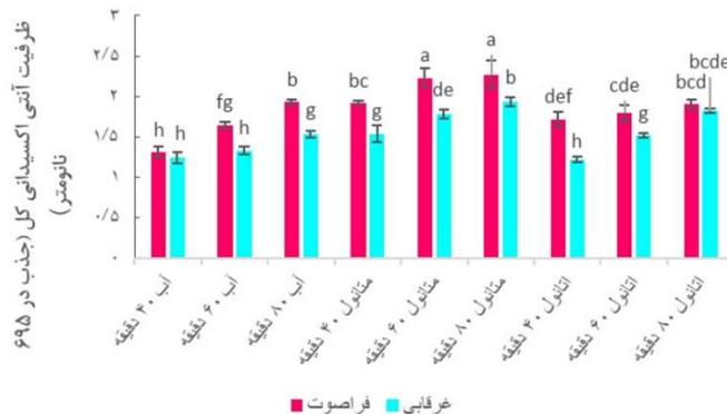
شکل ۶. مقایسه میانگین ظرفیت آنتی‌اکسیدانی کل عصاره‌های پوست بادمجان