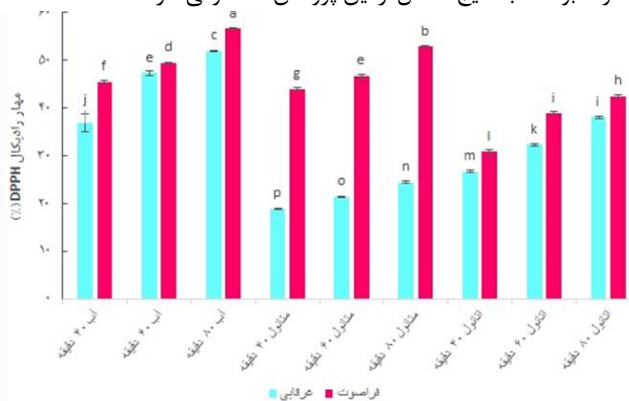
شکل ۴. اثر نوع حلال، زمان و روش استخراج بر فعالیت مهار رادیکال DPPH عصاره پوست بادمجان