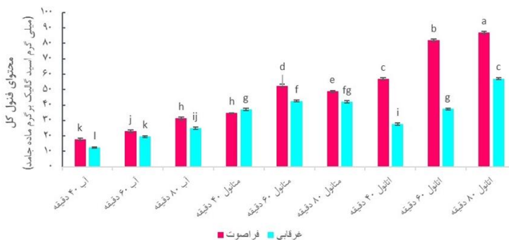
شکل ۱. اثر نوع حلال، زمان و روش استخراج بر مقدار فنل کل عصاره پوست بادمجان