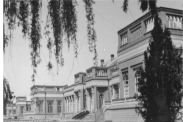
تصویر ۲) بیمارستان امام رضا

پیش از آن که در درگیری‌های موسوم به "قیام گوهرشاد" در سال ۱۳۱۴ شمسی، دستگیر و اعدام شود، نایب‌التولیه آستان قدس رضوی بود [38] . با کوشش و پشتکار او در این دوره، علاوه بر بسط و توسعه دارالشفای حضرتی در قیاس با مریض‌خانه ینگی دنیا، نقشه بنای عظیم یک دارالشفای (بیمارستان امام‌رضا امروزی) در اراضی زراعتی الندشت پیاده شد (تصویر ۲).