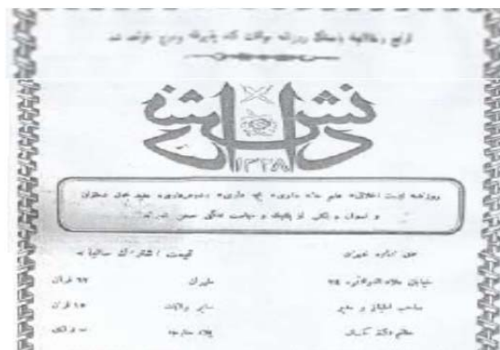
شکل ۴) سرصفحه نشریه دانش