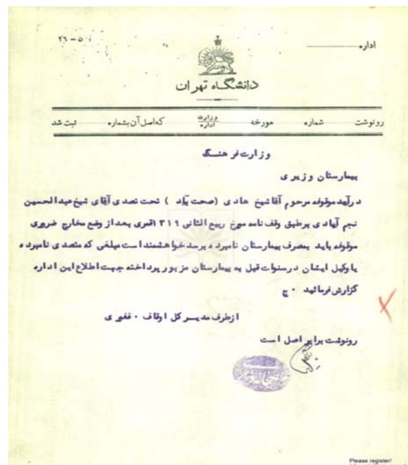
تصویر ۴) سند مربوط به پیگیری وضعیت موقوفه بیمارستان وزیری