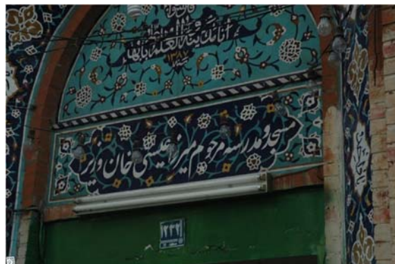
تصویر ۱۶) سردر مسجد و مدرسه موقوفه مرحوم میرزا عیسی‌خان وزیر (احداث‌شده توسط شیخ هادی نجم‌آبادی)

می‌پرداخت و سرانجام در چهارشنبه بیستم جمادی‌الآخر ۱۳۲۰ قمری جان به جان‌آفرین تسلیم کرد و با خوش‌نامی تمام، جهان فانی را وداع گفت [16] .