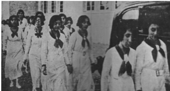
تصویر ۳) محصلان مدرسه ی قابلگی