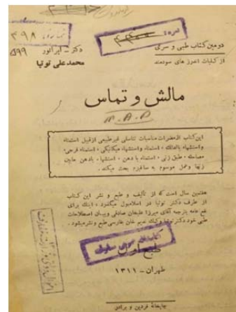
شکل ۴) صفحه نخستین کتاب "مالش و تماس" دکتر توتیا