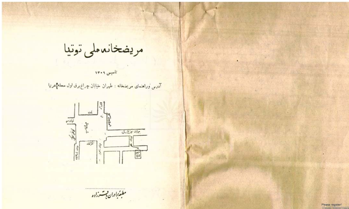
شکل ۲) نقشه جغرافیای ساختمان مریضخانه توتیا

این بنده دکتر محمدعلی توتیا (اپراتور) که مدت مدیدی برای تحصیل طب و جراحی به اسلامبول رفته بودم، اینک پس از اتمام تحصیلات عالییه قسمت‌های مذکوره و عملی نمودن آنها در دارالعلوم حکمییه و در مریضخانه‌های بزرگ به اخذ دیپلم و سرتیفیکای طب و جراحی نایل شده، فی‌الحال که به وطن خود مراجعت کرده‌ام، ماشین‌های مخصوصی برای معالجات امراض صعب‌العلاج به انضمام عده‌ای از دکترها و شیمیست‌های اروپایی که دارای دیپلم از فاکولت‌های (دانشکده‌ها) طبی اروپا هستند، برای تاسیس این مریضخانه همراه آورده تا در این موسسه که به نام «مریضخانه ملی توتیا» است، مشغول انواع معالجات باشند و برای تذکر به هموطنان عزیز لازم دانستم که قسمت‌های مختلف این مریضخانه را از لحاظ آنان بگذرانم.