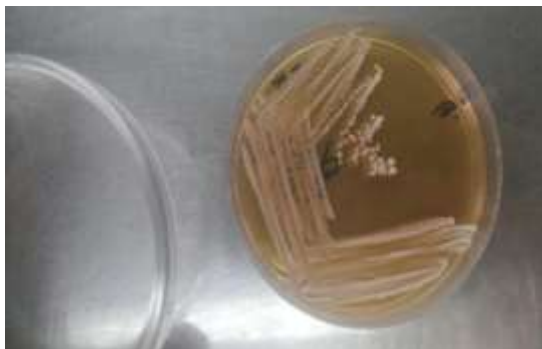
شکل ۱- کلنی‌های رشد کرده بر روی محیط ام‌آراس آگار

نتایج کشت نمونه‌های خمیر روی محیط کشت‌های ام‌آراس آگار و سابرو دکستروز آگار در شکل ۱ و ۲ نشان داده شده است. مورفولوژی جدایه‌ها در جدول ۱ مشخص شده است.