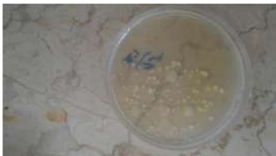
شکل ۲- کلنی‌های مخمیری رشد کرده بر روی محیط سابرو دکستروز آگار