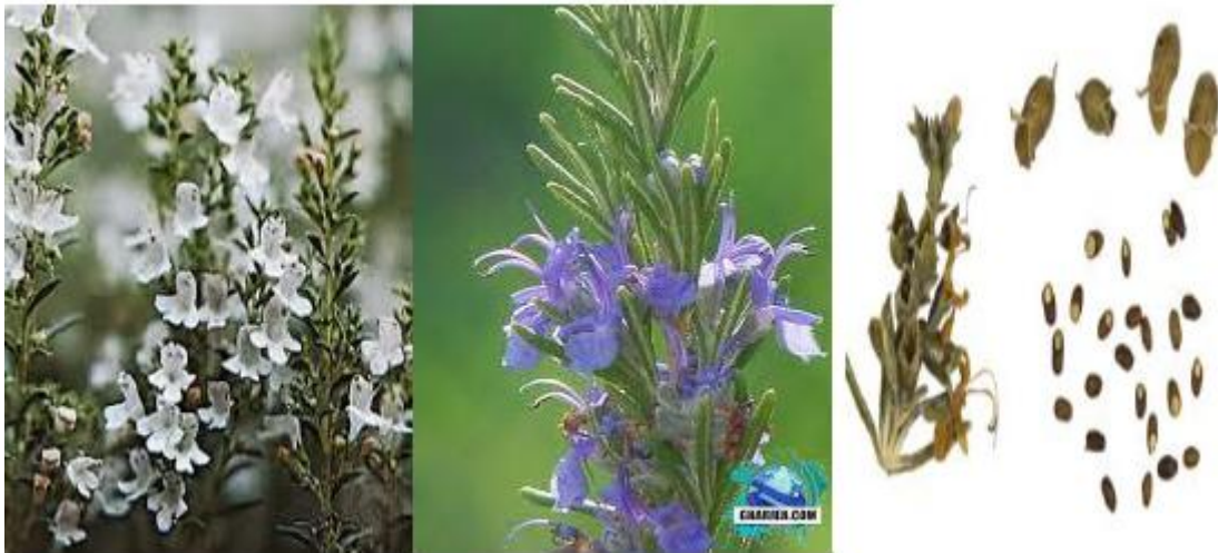
شکل ۲- مشخصات سیستماتیکی گیاه رزماری

این گیاه به طول ۱/۵ تا ۲ متر بوده و به صورت پایا و همیشه سبز به شکل بوته ای و معطر می باشد. برگ ها از نظر اندازه متنوع، باریک با انتهای بدون نوک و سوزنی شکل نازک و شاخه های متعدد آن هنگامی که جوان هستند، نرم و کرکدار بوده اما با گذشت زمان چوبی و سخت شده و پوست آن فلس مانند و قهوه ای مایل به خاکستری می شود (Bandara et al., 2007). سطح رویی برگ ها سبز پررنگ و زیر آن ها نرم و خاکستری کمرنگ می باشد. گل آذین به صورت افتاده و دارای چندین گل است و برگ های تغییر شکل یافته پایینی به صورت بیضی شکل و نوک تیز هستند (شکل ۲). از اوایل بهار تا اوایل تابستان، گل های دولپه ای به رنگ های آبی کم رنگ، بنفش و سبز تیره و به ندرت صورتی یا سفید رنگ به صورت خوشه ای از انتهای ساقه ظاهر می شود. گلبرگ ها دارای دو زبانه، یکی بالایی که از اتصال دو