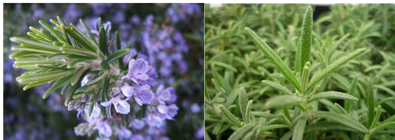
شکل ۱- گیاه رزماری

مارینوس (دریا) که به معنی شبنم دریاست گرفته شده است (Salehi Sardoei et al., 2020). همچنین این گیاه توسط یونانیان باستان، Antos (به معنای گل) یا Libantos (به دلیل بخور خوشبوی آن) نامیده می‌شود (Omidbegi, 2009).