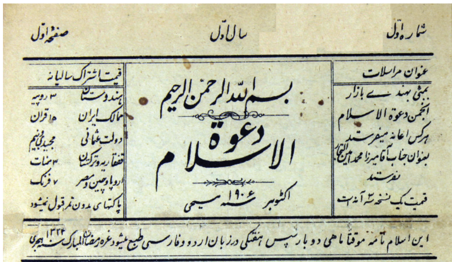
سرصفحه مجله سال اول شماره اول: سمت راست آدرس مجله، در وسط نام مجله، و در سمت چپ قیمت اشتراک سالانه

دو هفته نامه دعوت الاسلام که در فاصله های اکتبر ۱۹۰۶ تا سپتامبر ۱۹۰۷ در بمبئی منتشر می شد، در واقع ادامه ماهنامه الاسلام در جلفای اصفهان است. به لحاظ محتوایی، این مجله نیز عمدتاً متضمن سخنرانی ها و گفت وگوهای ادیبانی محمدعلی حسنی ملقب به داعی الاسلام در مبارزه با فعالیت های تبشیری مسیحیان است. از آنجایی که مجله الاسلام، به جهت انتشار دو تصحیح متفاوت از آن، ۱ و نگارش چندین مقاله در معرفی اش تا حدودی در جامعه علمی ما شناخته شده است، راقم این سطور لازم دید یک معرفی هم برای مجله کمتر شناخته شده دعوت الاسلام ۲ بنویسم تا چند گام بیشتر داعی الاسلام را همراهی کنیم.