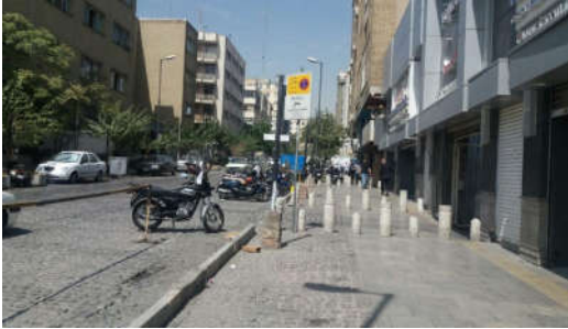
شکل ۵- تجهیز پیاده‌راه جانبی