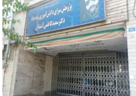
شکل ۱۰- ساختمان بلا تکلیف