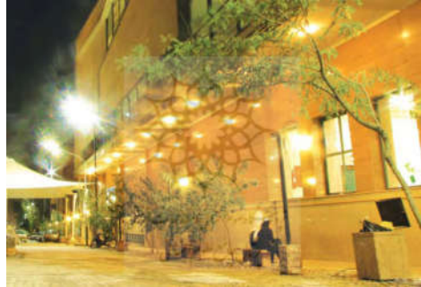
شکل ۴- مبلمان شهری (۳)