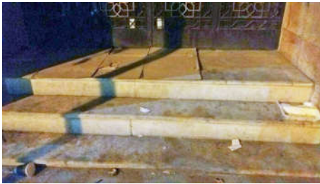
شکل ۱۶- مقابل پله‌های ساختمانی بلا تکلیف