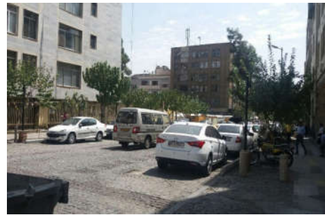
شکل ۶- پارک خودروها