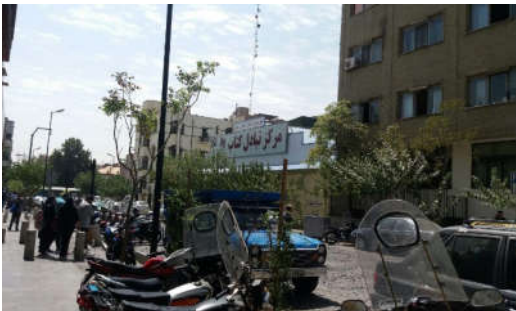
شکل ۷- پارک موتورسیکلت‌ها