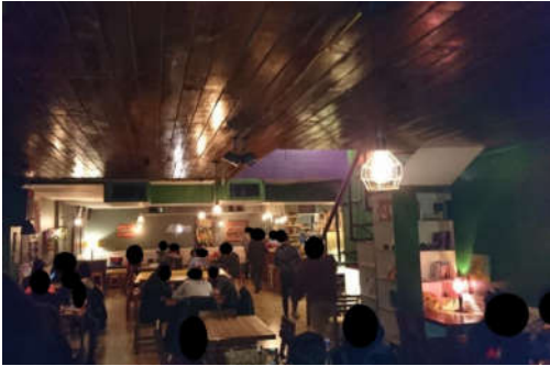
شکل ۱۳- نمای داخلی کافه ریچارد