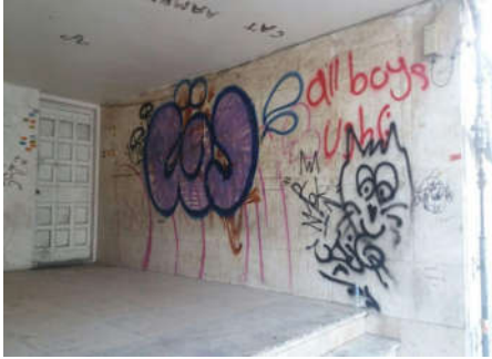
شکل ۱۱- ساختمان رهاشده