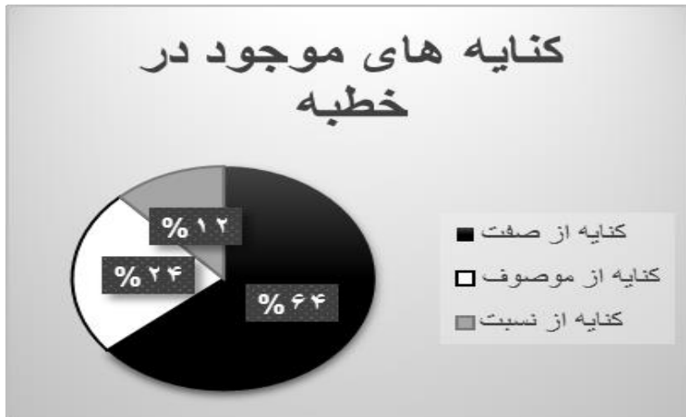
نمودار ۱: درصد انواع کنایه در خطبه قاصعه

از ۲۵ جمله کنایه‌ای در خطبه قاصعه، ۶۴٪ درصد کنایه از صفت، ۲۴٪ کنایه از موصوف و ۱۲٪ را کنایه از نسبت به خود اختصاص داده است.