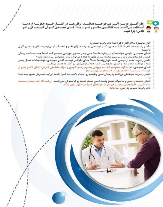
شکل (۴): گفتگوی شماره یک (اتاق دکتر رابرت) ۱

در گام نخست به منظور آماده کردن ذهن زبان آموزان با موضوع درس، از تصاویر مرتبط با عمل دعا کردن در فرهنگ‌های مختلف استفاده شده است. همچنین با در نظر گرفتن این تصاویر به درگیر کردن حس دیداری آنان و به تبع آن تولید هیجان مثبت جامعه عمل پوشانده شده است. در گام بعد، پرسش‌هایی به منظور برقراری پیوند تجربیات شخصی زبان آموزان با موضوع درس و ایجاد هیجان مثبت در آنان طراحی شده است. از سوی دیگر، این پرسش‌ها موجب پرورش مهارت تفکر در آنان می‌گردد. از این رو مدرس برای شروع درس از زبان آموزان در ارتباط با تصاویر و پرسش‌ها نظرخواهی کرده و بازخورد مناسب ارائه می‌دهد و در جمع‌بندی بحث نیز موضوع کلاس را به سمت مبحث دعا در میان فارسی‌زبانان هدایت می‌کند.