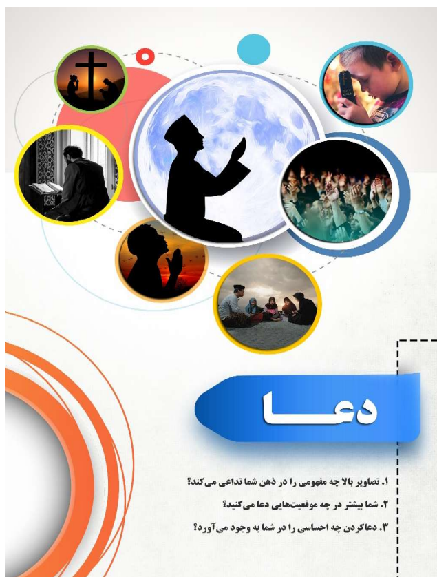
شکل (۳): صفحه عنوان درس

فرهنگ‌های گوناگون متفاوت است (پیش‌قدم و وحیدنیا، ۱۳۹۴: ۵۴). در فرهنگ ایرانی دعا کردن برای دیگران یکی از پربسامدترین زبانهنگ‌های رایج در میان افراد است و در بیشتر گفتمان‌های خیرخواهانه کاربرد دارد. جهت تبیین بیشتر الگوی زبامغز در تدوین مطالب آموزشی برای غیرفارسی‌زبانان در ادامه یک نمونه درس برای زبانهنگ دعا با توجه به این الگو طراحی و ارائه می‌شود؛ لازم به ذکر است به دلیل محدودیت در تعداد صفحات مقاله از پرداختن به موارد معمول در آموزش مانند توجه به تفاوت‌های گفتار رسمی و غیررسمی چشم‌پوشی شده است تا ویژگی‌ها و کارکردهای الگوی زبامغز در تهیه و تدوین مواد آموزشی گفتگو مهارت گفتگو بهتر تبیین شود.