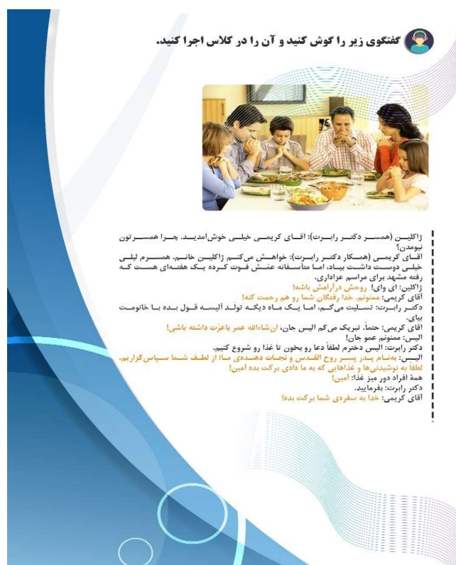
شکل (۸): گفتگو در مهمانی ۱

از آنجا که دعا مقوله‌ای بین‌المللی و بین‌فرهنگی است و در همه فرهنگ‌ها به اشکال و عبارات گوناگون وجود دارد، در این بخش با مقایسه تطبیقی پاره‌گفتارهای آن در فرهنگ زبان‌های مبدأ (عربی و انگلیسی) با زبان فارسی، به اهمیت جایگاه هیجانات مثبت در یادگیری توجه شده است. همچنین در تمرین بعد با طراحی یک موقعیت، با پیش‌بینی و طراحی مسیر درست توسط زبان‌آموزان به پرورش تفکر آینده‌نگر آنان پرداخته شده است. همچنین افزون بر پرورش تفکر آینده‌نگر، به آنان نشان داده می‌شود که یک مفهوم را می‌توان به دو گونه دارای بار هیجانی مثبت و منفی بیان کرد و انتخاب درست آن در موقعیت‌های مختلف به دلیل تأثیری که بر مخاطب می‌گذارد، بسیار حائز اهمیت است.