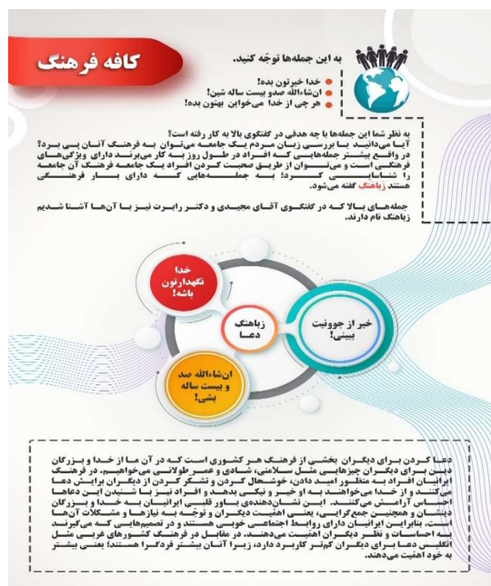
شکل (۶): توضیح فرهنگ نهفته در زیاهنگ دعا

پس از ارائه گفتگو، در این بخش تمرینی با هدف پرورش تفکر خلاق زبان آموزان طراحی شده است که بر اساس این تمرین آنان باید در قالب یک فعالیت گروهی به کشف پاره گفتارهای مربوط به زیاهنگ دعا در جدول پردازند. به منظور درگیر کردن حواس آنان نیز بیشتر عبارتها مانند «ساز زندگی شاد»، «کیفتون کوک»، «گل خنده رو لباتون» دارای وزن حسی می باشند؛ در واقع، در دو عبارت اول به جای استفاده از عبارت «زندگی شادی داشته باشید» از واژه های «ساز» و «کوک» بهره گرفته شده است تا صدای ساز و تصویر آن را نیز در ذهن متبادر کند و به جای آوردن «همیشه شاد باشید» عبارت «گل لبخند رو لباتون» لبخند به گل تشبیه شده و تصویر و عطر گل را نیز برای فراگیر به ارمغان می آورد که این امر تولید هیجانات مثبت را نیز با خود به همراه دارد. این امکان برای مدرس وجود دارد که این تمرین را به صورت مسابقه در کلاس اجرا کند و گروهی که عبارتهای بیشتری را کشف کرد به عنوان برنده معرفی نماید.