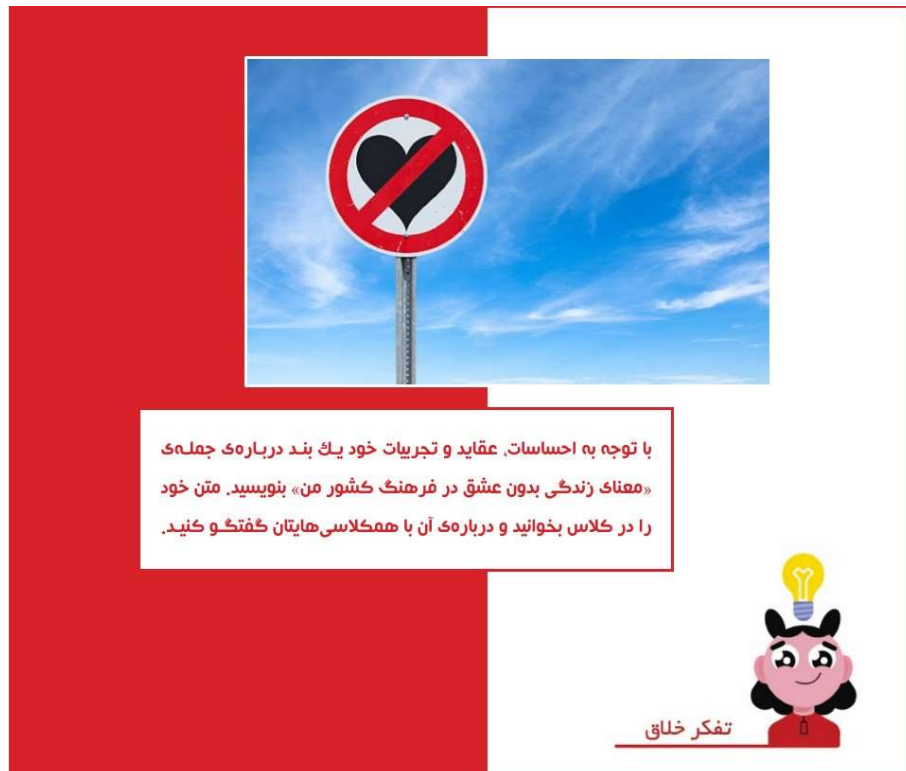
شکل ۷: توجه به احساسات و عقاید در آموزش

زبان آموزان با یکدیگر است، در این نوع از آموزش حائز اهمیت می‌باشد. این تمرین که با هدف تقویت توانایی‌های گفتاری و شنیداری و نیز ارتقای تفکرهای خلاق و آینده‌نگر در فراگیران طراحی شده است، با دور کردن فراگیران از انزوا و ترغیب ایشان به فعالیت گروهی، منجر به بهبود مدیریت درون‌فردی و میان‌فردی آنان نیز می‌شود. در چنین شرایطی زبان آموزان می‌توانند از طریق تماس تلفنی، پیام‌رسان واتساپ و غیره با یکدیگر در ارتباط باشند و متن مکالمه خود را تنظیم کنند. آن‌ها می‌توانند برای خلاقانه نمودن ارائه کلاسی خود روش‌های مختلفی به کار برند. به عنوان مثال استفاده از موسیقی ملایم هنگام مکالمه می‌تواند بر جذابیت کار ایشان بیفزاید. هر چند تصور بر این است که در چنین موقعیت‌هایی توجه تمامی زبان آموزان معطوف به کلاس باشد اما مدرس می‌تواند جهت اطمینان و نیز جلوگیری از منفعل شدن سایر افراد کلاس سؤال یا سؤالاتی تستی از دل مکالمه طرح کند و از سایر زبان آموزان بخواهد به آن پاسخ دهند.