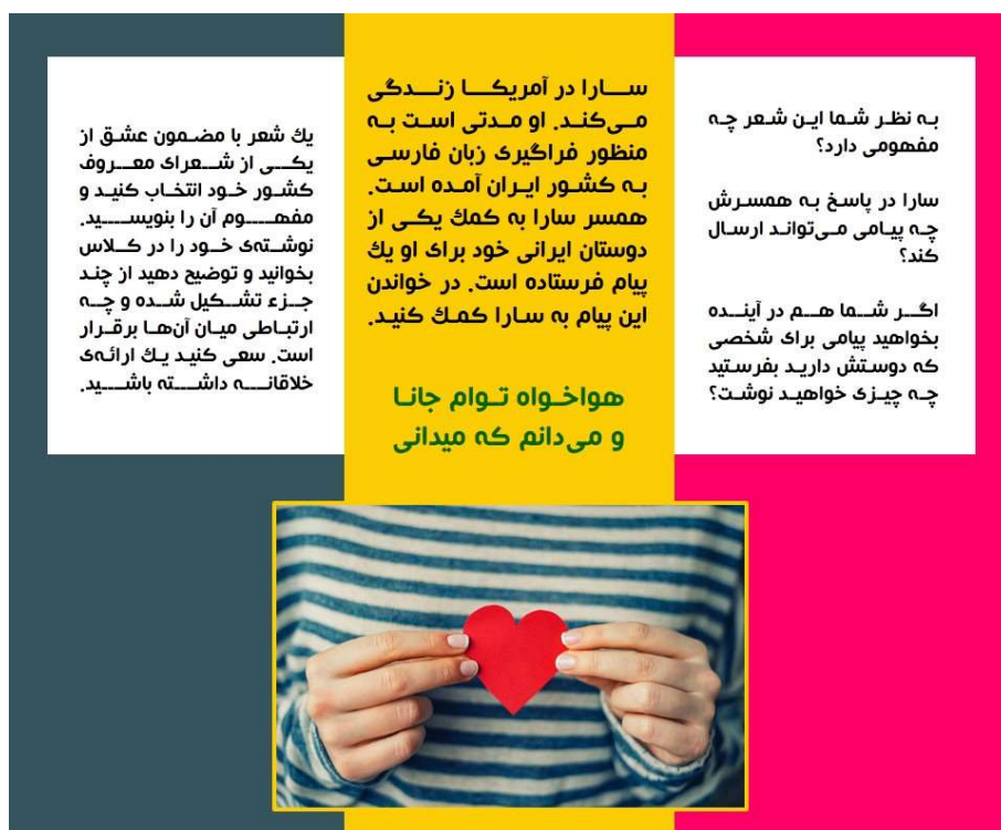
شکل ۹: تمرین انواع تفکر، حواس و هیجان

به نظر می‌رسد یکی از راه‌های تقویت مهارت‌های زبانی استفاده از روایت‌هاست که با استفاده از امکانات موجود در بسترهای آموزش مجازی به راحتی امکان‌پذیر است. واضح است روایت‌ها افزون بر اینکه می‌توانند گوشه‌ای از فرهنگ یک کشور را در خود جای دهند، ضمن درگیر نمودن حواس فراگیران، منجر به افزایش هیجانات مثبت در ایشان می‌شوند. به عنوان مثال روایت فوق در بر دارنده زیانگ‌های «پاره‌گفتارهایی از زبان که بخشی از فرهنگ در آن نهفته است» درباره خواستگاری ایرانی است که ضمن توجه به ارزش‌ها و فرهنگ، حواس و هیجانات فراگیران را نیز درگیر می‌کند. در این راستا به منظور معطوف نمودن توجه مخاطبان به کلاس مجازی و نیز تقویت مهارت‌های زبانی، استفاده از بازی‌های گروهی سودمند می‌نماید. بنابراین بازی گروهی فوق که با هدف تقویت مهارت خوانداری زبان آموزان طراحی شده است با درگیر نمودن هیجانات فراگیران، آنان را ترغیب به مشارکت کلاسی کرده، منجر به بهبود توانایی مدیریت درون‌فردی و میان‌فردی در ایشان می‌شوند و مدرس را در دست‌یابی به اهداف آموزش یاری می‌دهند.