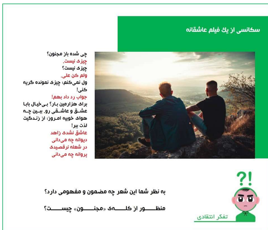
شکل ۳: سکانسی از یک فیلم عاشقانه

کلاسی در فضای الکترونیکی نشان دادن بازخوردی مناسب به آن‌ها است؛ به طور مثال گاه یک کلام مثبت یا محبت‌آمیز تأثیری بلندمدت بر انگیزه فراگیران خواهد داشت.