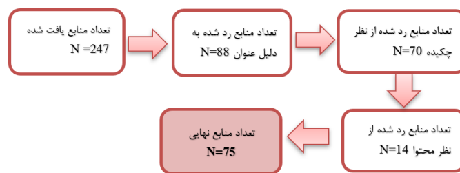
شکل ۱: فرآیند و تعداد منابع بررسی شده در فراترکیب

نمونه‌گیری در مقاله مورد بررسی ۵- روش و کیفیت جمع‌آوری داده‌ها ۶- میزان انعکاس‌پذیری امکان بسط دادن نتایج و دستاوردها مقاله مورد بررسی ۷- میزان و نحوه رعایت نکات اخلاقی رایج در زمینه تدوین متون پژوهشی در مقاله مورد بررسی ۸-میزان دقت در زمینه تجزیه و تحلیل داده‌ها در مقاله مورد بررسی ۹- وضوح بیان در ارائه یافته‌های مقاله مورد بررسی ۱۰- ارزش کلی مقاله مورد بررسی، از آنجا که ۱۰ ویژگی وجود دارد و حداکثر امتیاز هر ویژگی ۵ می‌باشد بنابراین بیشترین نمره‌ای که هر مقاله براساس مقیاس CASP کسب می‌کند، ۵۰ می‌باشد. ساده‌ترین روش آن است که هر مقاله‌ای که پایین‌تر از ۲۵ امتیاز دارد حذف شود. روبریک برای این منظور پنج دسته را مطرح کرده است: ضعیف (۰ تا ۱۰) - متوسط (۱۱ تا ۲۰) - خوب (۲۱ تا ۳۰) - خیلی خوب (۳۱ تا ۴۰) - عالی (۴۰ تا ۵۰). در جدول شماره ۲ به طور خلاصه مؤلفه‌های تردیدحرفه‌ای نشان داده شده است.