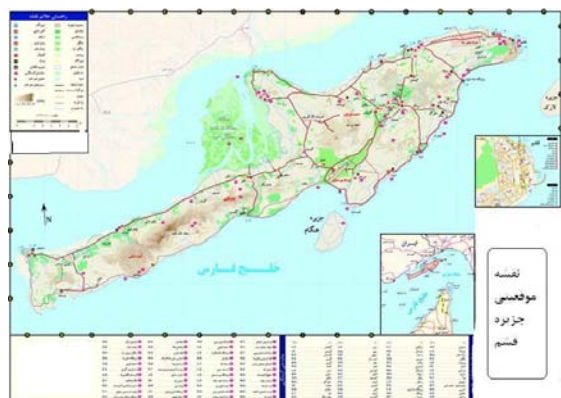
نقشه شماره ۱. موقعیت جزیره قشم.

دشت جزیره دشت توریان در شرق است. خورخمیر در شمال غربی جزیره قشم (خور یا تنگه خوران) واقع گردیده و از جنوب با خور لافت در ارتباط می باشد و دربرگیرنده یکی از بزرگترین جوامع گیاهی حرا (مانگرو) در کرانه جنوبی ایران می باشد. قشم در دهانه تنگه هرمز است. این جزیره مدخل ورودی خلیج فارس از دریای عمان (تنگه هرمز) قرار دارد. مساحت جزیره ۱۴۹۱ کیلومتر مربع حدود ۲/۵ برابر کشور بحرین است. طول جزیره از بندر قشم تا باسعیدو بین ۱۰۰ تا ۱۳۰ کیلومتر است و عرض آن در شهر قشم ۵ کیلومتر و قسمت باسعیدو تا روستای دوستکو حدود ۱۲ کیلومتر است. به لحاظ تقسیمات کشوری جزیره دارای یک شهرستان دو بخش (قشم و شهاب)، سه شهر (قشم، هرمز، سوزا) و هفت دهستان تقسیم می شود. طبق جدول شماره (۱) جمعیت شهرستان قشم در سال ۱۳۸۵ معادل ۱۰۵۳۳۵ نفر بوده و در طول دهه (۱۳۷۵-۱۳۸۵) بطور متوسط سالانه معادل ۳/۷ درصد رشد داشته است. تغییرات جمعیت در سال ۱۳۸۵ نسبت به سال ۱۳۷۵، برابر ۴۴/۳ درصد است. همچنین در سال ۱۳۸۵ از تعداد کل جمعیت شهرستان ۵۸/۶ درصد آن را جمعیت روستایی تشکیل داده است (مرکز آمار ایران، ۱۳۸۵). نقشه شماره (۱) موقعیت جغرافیایی قشم را نشان می دهد.