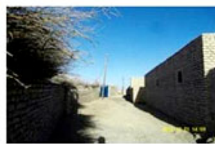
الف. کوچه شمالی - جنوبی