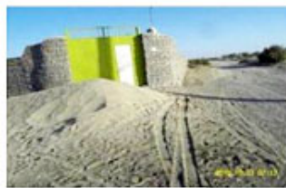
ب. کوچه شرقی - غربی

"ت ۵" (الف و ب) وضعیت کالبدی معابر و (ج و د) بستر رودخانه روستای تمبکاء (مطالعات میدانی نگارندگان، ۹۰-۱۳۸۹).