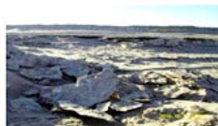
د. فرسایش بستر رودخانه