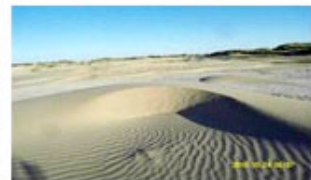
ج. حرکت ماسه در بستر رودخانه