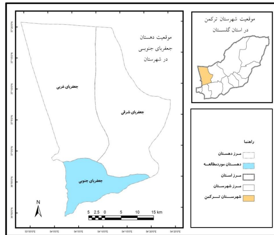
ت 1. موقعیت ناحیه مورد مطالعه.

ناپارامتری و برای سنجش تفاوت میان فراوانی‌های مشاهده شده و مورد انتظار) و آماره تمایل مرکزی میانگین مورد تجزیه و تحلیل قرار گرفته است.