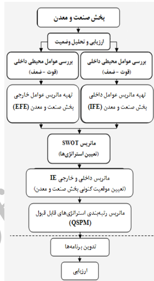
ن ۲. مدل برنامه‌ریزی استراتژیک بخش صنعت و معدن استان خراسان جنوبی.

جهت ارتقا و بهبود وضع موجود با به‌بیان دیگر در راستای تقویت نقش بخش صنعت و معدن (با توجه به توان بالقوه آن در استان) در توسعه منطقه خراسان جنوبی، استراتژی‌ها و راهبردهای متعددی را می‌توان به‌کار بست که براساس بررسی‌ها و محاسبات صورت گرفته در این تحقیق، راهبرد ایجاد و توسعه زیرساخت‌های مورد نیاز بخش صنعت و معدن و محیط زیست، تکمیل شبکه‌های حمل و نقل و حامل‌های انرژی و توزیع زیرساخت‌ها متناسب با تقاضای سرمایه‌گذاری، از برترین اولویت اجرا برخوردار است.