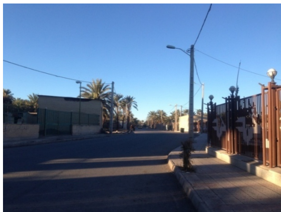
ت ۱. محله امامزاده زید.

محله امامزاده زید همراه محله سید طاهرالدین در شرق بم واقع شده است.