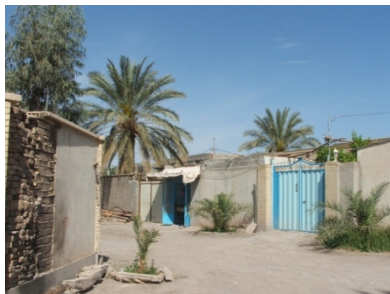
۳. محله قصر حمید.

محله قصر حمید از محلات اولیه شکل گرفته بعد از خارج شدن توسعه شهر از ارگ است که پیش از سال ۱۲۸۵ نیز وجود داشته و جایگاه سکونت اولیه خوانین بمی بعد از خروج از ارگ بوده است. قرارگیری در مرکز شهر و همجواری با بازار شهر از ویژگی‌های اصلی این محله به‌شمار می‌آید.