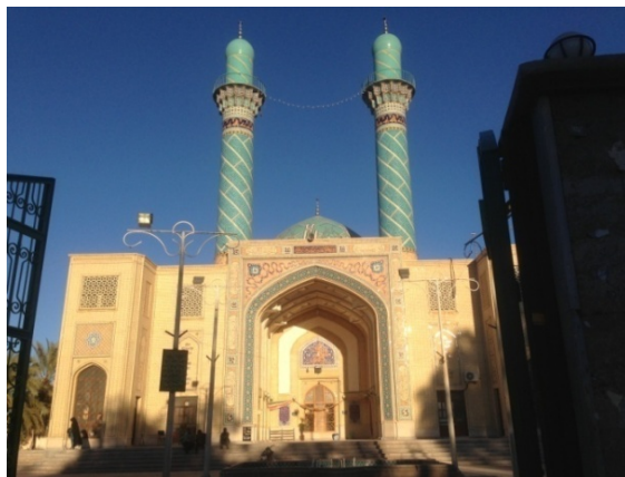
۲. بنای امامزاده زید.

حدود ۲۱۵۹ نفر بوده که بعد از وقوع زلزله به ۱۵۲۴ نفر کاهش یافته است. درصد تخریب محله نیز بالای ۸۰ درصد بوده است. در حال حاضر جمعیت محله حدود ۲۰۰۰ نفر و میزان بازسازی‌های انجام‌شده واحدهای مسکونی مطابق مطالعات میدانی حدود ۸۵ درصد است.