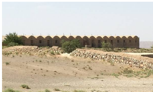
ت 5. یک واحد مرغداری گوشتی در طینوج. (نگارندگان، تیر 1394).

استفاده از مصالح بوم‌آورد یک از ارکان معماری ایران است (پیرنیا، 1383). این مصالح باعث تکمیل فرایند عایق‌سازی بنا در برابر تغییرات دمایی خواهد بود و مشکلات مربوط به حمل و نقل مصالح از دوردست به