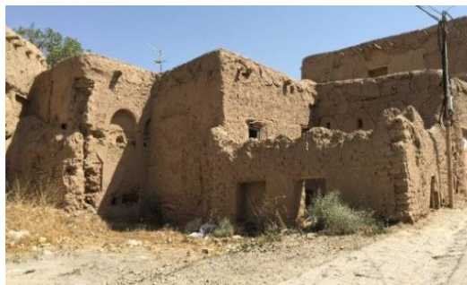
ت 2. قلعه طوسی نوژ. (نگارندگان، تیر 1394).