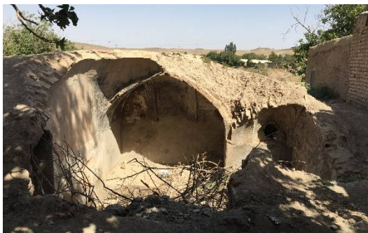
ت 6. آثار بجا مانده از معماری کویری طینوج. (نگارندگان، تیر 1394).

یکسان دارند. به کارگیری کلیه عوامل اقلیمی جهت ایجاد حرارت و یا برودت مورد نیاز، جزو اصول اولیه معماری سنتی ایران بوده است. همان گونه که از تابش آفتاب و مصالح ساختمانی جهت تأمین و ذخیره نمودن حرارت استفاده می‌شده، سرمای زمستان، دمای بسیار پایین آسمان در شب هنگام و عایق بودن نسبی عمق زمین نیز به منظور ایجاد برودت و ذخیره آن مورد استفاده قرار می‌گرفته است. باید گفت که کاربرد معماری اقلیمی و نحوه استفاده از اقلیم و معماری در جهت تأمین شرایط بهینه عملکرد گوارنده در طی فصول مختلف سال و در مناطق آب و هوایی در جای جای قلمرو معماری گذشته ثابت شده است. همانگونه که در بخش‌های قبل گفته شد قرارگرفتن گوارنده در محدوده 25 تا 35 درجه سانتیگراد از الزامات عملکرد مناسب فرایند هضم است. معماری اقلیمی ایران با استفاده از فرم و مصالح ساختار پایداری را خلق کرده است که می‌تواند در مناطق کویر نیز تغییرات عمده دما شب و روز را کنترل کند (تاری، 1394).