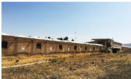
ت 4. یک واحد مرغداری گوشتی در طینوج. (نگارندگان، تیر 1394).

همچنین 32 واحد گلخانه‌های موجود در مجاورت روستای طینوج نیز می‌توانند از کود حاصله از گوارنده زیست‌توده برای تولید محصولات ارگانیک استفاده کرده و برق مورد نیاز خود را از این فرایند تأمین نمایند.