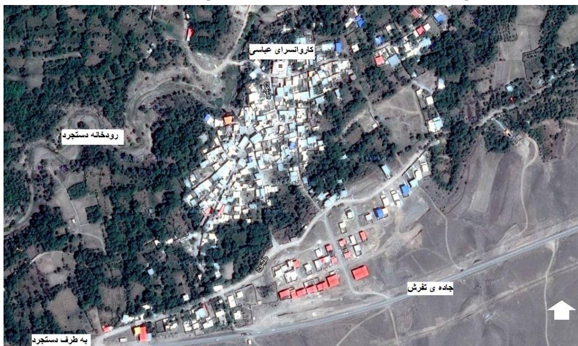
ت 1. موقعیت جغرافیایی روستای طینوج. http://www.behrah.com/map.php

شناسایی و آمار و اطلاعات دقیق آن‌ها از مراجع ذیربط اخذ گردید و سپس با توجه به ضرایب استحصال و میزان تولید فضولات هر رأس دام، مقدار فضولات قابل دسترس هر دام برای تولید بیوگاز محاسبه گردیده است که در نتیجه آن مشخص گردید استان قم یکی از پنج استان اول، دارای منابع بالقوه زیست‌توده است