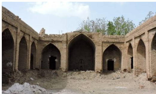
ت 3. کاروانسرای عباسی. (نگارندگان، تیر 1394).