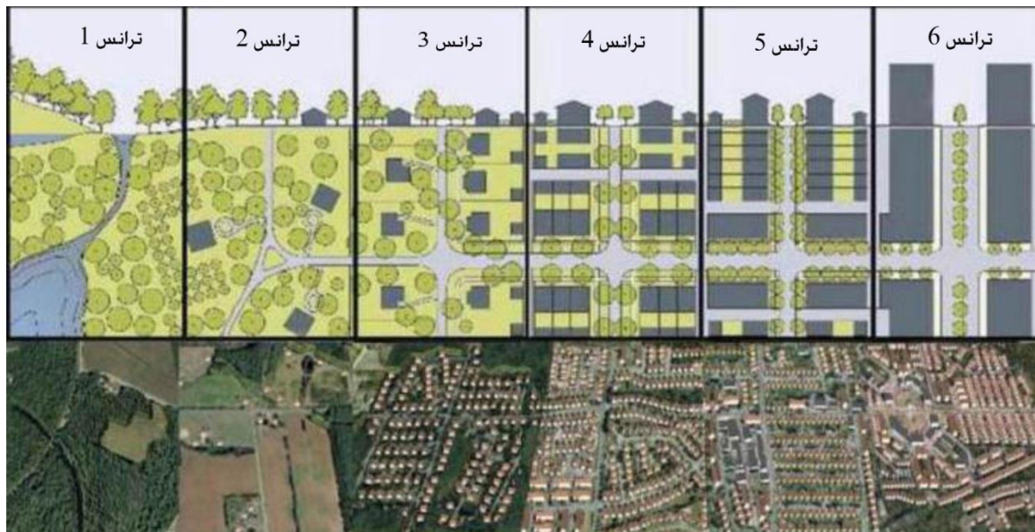
ت ۱. نمایی از ترانس و منطقه‌بندی آن.

روستاها، شهرک‌های اطراف شهر ۱۹ و مرکز شهر را نمایش می‌دهد. سکونتگاه واقع شده در