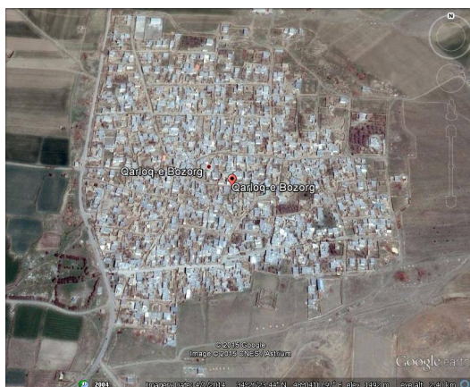
ت 3. نقشه شهرستان قارلق.

آلفای کرونیباخ برای گویه‌ها و سؤال‌های اشاره شده، محاسبه شد. میزان این ضریب که در اصل، میزان پایایی ابزار را مشخص می‌کند، برای بخش دوم و سوم و چهارم ابزار، به ترتیب 86/0، 88/0 و 85/0 به دست آمد. در کل 168 پرسشنامه کامل و بدون نقص تکمیل شد (نرخ پاسخگویی = 91 درصد). پس از تکمیل داده‌ها عملیات کدگذاری، استخراج اطلاعات و انتقال آن‌ها بر روی رایانه صورت پذیرفت. پس از طی فرایند داده‌پردازی، محاسبات آماری (توصیفی و استنباطی) با استفاده از برنامه SPSS نسخه 20 انجام شد.