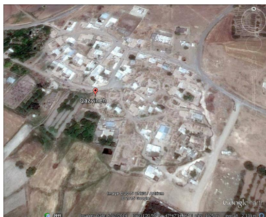
ت 2. نقشه شهرستان قزوین.