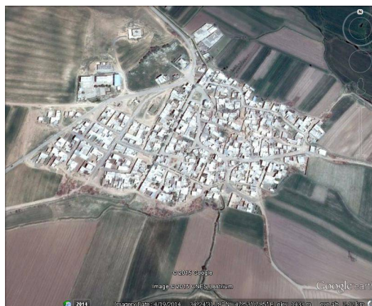
ت 4. نقشه شهرستان دهلر.

از بین مؤلفه‌های مختلف خرده فرهنگ‌های راجرز، میزان تقدیرگرایی و پایین بودن سطح آرزوها و تمایلات بیش از سایر مقوله‌ها در بین روستاییان مورد مطالعه وجود دارد. در این بین کمترین اولویت‌ها به فقدان همدلی و عدم اعتماد متقابل در روابط شخصی اختصاص یافته است (جدول شماره 4).