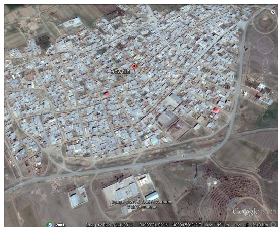
ت 1. نقشه شهرستان گودین.