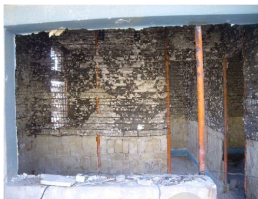
ت 4. اسکلت ساختمان‌های بازسازی شده.

فروش و واگذاری زمین شهر جدید به مرور زمان تکمیل شد. در ابتدای برنامه جمعیت، ساخت 400 دستگاه خانه و واگذاری آن‌ها به صورت رایگان به افراد محق بود. پس از مدتی طرح و واگذاری زمین رایگان نیز اجرا شد. واگذاری خانه‌ها با نظر شورای شهر متشکل از معتمدین محلی و چند تن از مسئولان جمعیت انجام می‌شد. شورای شهر وضع اقتصادی مردم را مطالعه کرده و افراد به پنج درجه تقسیم می‌شدند. در نتیجه، عده‌ای خانه دریافت کردند و به عده‌ای دیگر به تناسب وضعیت مالی آن‌ها خانه‌ها با اقساط طولانی مدت فروخته می‌شد (کاشفی، ص 77). البته خانوارهایی که خانه‌های آن‌ها به‌طور کامل تخریب شده بود نیز خانه رایگان دریافت کردند. 6 ارزش زمین به نسبت عرض خیابان‌ها تعیین می‌گردید. یک سوم بهای زمین نقد و بقیه آن به صورت اقساط بلندمدت دریافت می‌شد. فلسفه فروش خانه‌ها ایجاد علاقه‌مندی و احساس مالکیت نسبت به خانه‌ها و مشارکت در آبادانی منطقه‌ای که خانه در آن قرار گرفته، ذکر شده است (کاشفی، ص 77-76).