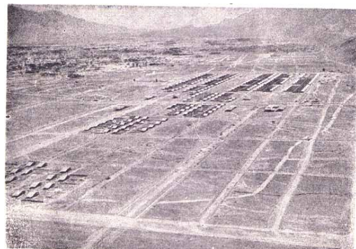
ت 3. شهر جدید لار.

طراحی، نظارت و اجرای نقشه شهر جدید توسط مهندسین شرکت نفت صورت پذیرفت. شهر جدید به‌صورت 12 خیابان شمالی-جنوبی و 12 خیابان شرقی-غربی با عرض‌های 12، 20، 30، 45 متری طراحی شده بود (کاشفی، صص 65، بنی‌زمان، صص 30-31) (تصویر شماره 3). البته توسط مهندس ایرانی تبار شرکت "انترپوز"، تغییراتی در نقشه شهر پیشنهاد شد و مورد تأیید قرار گرفت. این پیشنهادها در مواردی مانند تقلیل عرض خیابان‌ها، خالی گذاشتن قطعاتی در تقاطع‌ها به‌منظور ساخت واحدهای تجاری و تغییر مکان ادارات و موسسات عمومی از داخل به بولوار بین دو شهر بود.