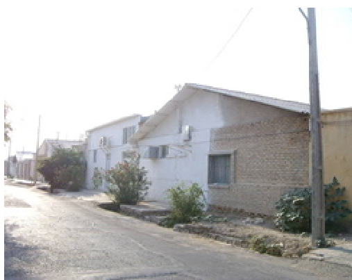
ت 6. نمای خارجی خانه‌های بازسازی شده. دو پلاک مجاور یکدیگر.