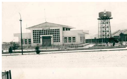
ت 8. از ادارات دولتی، ساختمان بانک سپه در شهر جدید.