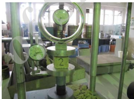
ت ۱. آزمایش مقاومت فشاری به وسیله دستگاه تک محور.

صاف یک تخته چوبی چسبانده شده است، ۹۰ بار در یک جهت روی نمونه مکعبی کشیده شدند و پس از اتمام آزمایش دوباره نمونه‌ها به مدت ۲۴ ساعت در دمای ۶۰ درجه سانتی‌متر خشک شده و دوباره وزن شدند (M2). اختلاف وزن اول و دوم نمونه (M1- M2) میزان فرسایش وزنی آن را نشان می‌دهد. در این آزمایش به تعداد نمونه‌ها، تکه سنباده‌های یک اندازه و با درجه زبری یکسان تهیه گردید و برای هر نمونه فقط یک تکه از سنباده استفاده شد. قالبی گچی به وزن ۳۰۰ گرم نیز روی تخته‌های چوبی نصب شد تا از نیروی دست برای وارد کردن فشار عمودی استفاده نشود و میزان نیرو با حداقل خطا در طول آزمون ثابت باشد (تصویر شماره ۲).