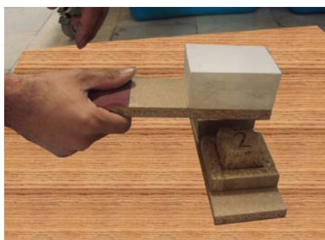
ت ۲. آزمون مقاومت سایشی.

برای آزمایش جذب مویینگی نمونه خشت‌ها به مدت ۲۴ ساعت در دمای ۶۰ درجه سانتی‌گراد در اون قرار داده شد تا رطوبت آن بخار شود و کاملاً خشت گردد. سپس خشت‌ها در دسیکاتور خنک شدند (به مدت نیم ساعت تا ۱ ساعت). پس از آن کف یک سینی یک تکه ابر به ضخامت ۱ سانتی‌متر و پارچه‌ای نخی روی آن قرار داده شد و به اندازه ضخامت ابر به سینی آب مقطر اضافه شد خشت‌ها به فاصله زمانی ۱۰ ثانیه پشت سر هم داخل سینی روی ابر قرار گرفته و به فاصله‌های زمانی معین شده برای این آزمایش، ارتفاع آب بالا آمده در خشت‌ها اندازه گرفته شد (تصویر شماره ۳). لازم است که هر چند دقیقه دوباره به سینی آب مقطر اضافه گردد تا آب جذب شده در نمونه‌ها جبران شود. این کار تا زمان بالا آمدن آب در چهار وجه خشت و اشباع کامل ادامه یافت و زمان نهایی ثبت گردید. پس از این آزمون و پس از اشباع کامل نمونه‌های خشت، روی آن‌ها آزمون مقاومت فشاری انجام پذیرفت تا مقاومت در مقابل فشار نمونه‌های خیس نیز اندازه گیری گردد.