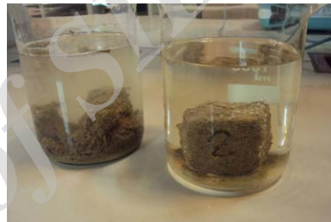
ت ۴. آزمایش غوطه‌وری (نمونه شماره ۱ و ۲).

۸۰۰ میلی‌لیتر آب مقطر اضافه شد و سپس نمونه خشت‌ها به بشرها منتقل شدند. در فاصله‌های زمانی یکسان میزان تخریب نمونه‌ها به صورت کیفی بررسی شده و نتایج به صورتی که در این جدول دیده می‌شود، ثبت گردید. یکسان بودن شرایط برای همه نمونه‌ها شرط اصلی صحت این آزمون است، لذا انتخاب ظرف، حجم آن و سایر ویژگی‌ها بر عهده پژوهشگر می‌باشد اما بهتر آن است که در این آزمون نمونه کاملاً در آب غرق شده باشد و میزان این آب برای همه نمونه‌ها مساوی باشد (تصویر شماره ۴).