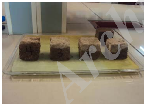
ت ۳. آزمون مویینگی.

برای آزمایش جذب مویینگی نمونه خشت‌ها به مدت ۲۴ ساعت در دمای ۶۰ درجه سانتی‌گراد در اون قرار داده شد تا رطوبت آن بخار شود و کاملاً خشت گردد. سپس خشت‌ها در دسیکاتور خنک شدند (به مدت نیم ساعت تا ۱ ساعت). پس از آن کف یک سینی یک تکه ابر به ضخامت ۱ سانتی‌متر و پارچه‌ای نخی روی آن قرار داده شد و به اندازه ضخامت ابر به سینی آب مقطر اضافه شد خشت‌ها به فاصله زمانی ۱۰ ثانیه پشت سر هم داخل سینی روی ابر قرار گرفته و به فاصله‌های زمانی معین شده برای این آزمایش، ارتفاع آب بالا آمده در خشت‌ها اندازه گرفته شد (تصویر شماره ۳). لازم است که هر چند دقیقه دوباره به سینی آب مقطر اضافه گردد تا آب جذب شده در نمونه‌ها جبران شود. این کار تا زمان بالا آمدن آب در چهار وجه خشت و اشباع کامل ادامه یافت و زمان نهایی ثبت گردید. پس از این آزمون و پس از اشباع کامل نمونه‌های خشت، روی آن‌ها آزمون مقاومت فشاری انجام پذیرفت تا مقاومت در مقابل فشار نمونه‌های خیس نیز اندازه گیری گردد.