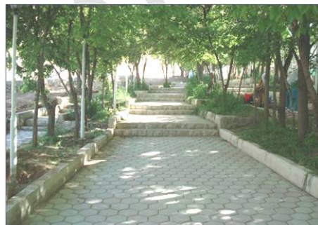
تصویر 8. بهسازی معابر پیاده.