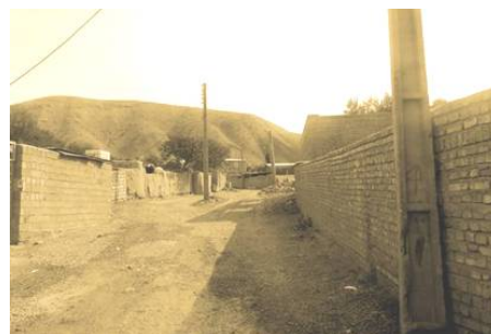
ت 5 و 6. بافت جدید و عریض روستایی.

رعایت اصول مقیاس انسانی باید فرایندی طبیعی در طراحی بافت باشد تا بتواند مردم را به راه رفتن دعوت کند. موفقیت در برنامه‌ریزی و طراحی کالبدی خوب برای انسان، مستلزم توجه به فیزیک بدن، حواس و توان حرکتی او و به عبارت دیگر در طراحی متناسب با بدن انسان خلاصه می‌شود. برای این منظور و بالا بردن کیفیت فضا، ساختن و بر پا کردن کالبدی در تراز چشم ضرورتی اساسی است و باید سعی نمود همه اتفاقات زیبایی‌شناسانه در سطح ارتفاع چشم شکل گیرد.