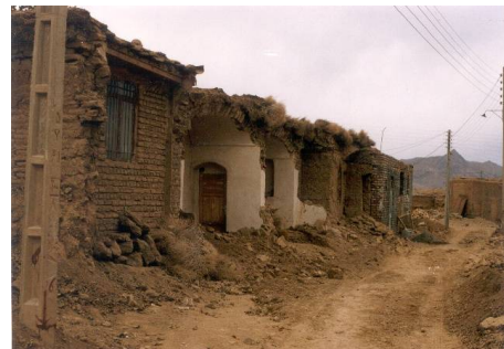
ت 1 و 2. تعریض معابر برای سهولت تردد اتومبیل و تخریب بافت‌های روستایی.