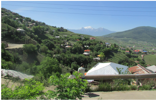
ت 3. بافت روستای کوهپیر.

روستای کوهپیر در بخش کلاردشت، شهرستان چالوس و در مسیر جاده بین روستای کردیچال - شکر کوه واقع شده است (تصویر شماره 3). این روستا به لحاظ موقعیت در طول جغرافیایی 51 درجه و 23 دقیقه شرقی و در عرض جغرافیایی 36 درجه و 40 دقیقه شمالی قرار گرفته است و ارتفاع آن از سطح دریا برابر با 1400 متر می‌باشد. فاصله روستا از مرکز شهرستان چالوس 50 کیلومتر و از مرکز دهستان کردیچال 2 کیلومتر می‌باشد. این روستا از شمال به روستای کلمه، از جنوب به روستای کردیچال، از غرب به کوه‌ها و اراضی ملی و از شرق به روستای شکرکوه محدود می‌گردد (بنیاد مسکن انقلاب اسلامی استان مازندران، 1384).