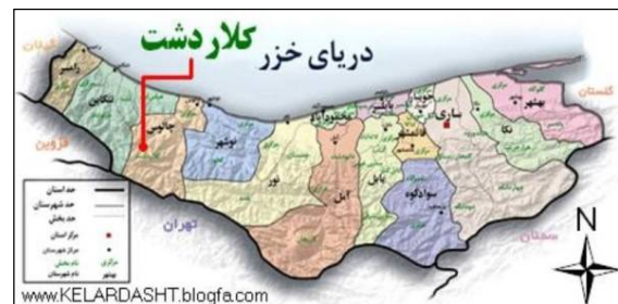
ت 2. موقعیت کلاردشت در نقشه.

کلاردشت در استان مازندران قرار دارد و از توابع شهرستان چالوس می‌باشد (تصویر شماره 2) که از جنوب به قله تخت سلیمان تا حدود گردنه کندوان و از شمال به دریای خزر و شهر تنکابن و از شرق به چالوس، نوشهر و کجور و از غرب به قزوین و الموت محدود است و در ارتفاع 1250 متری و در فاصله 191 متری از شهر تهران قرار گرفته است (رهنمایی و همکاران، 1386: 21).