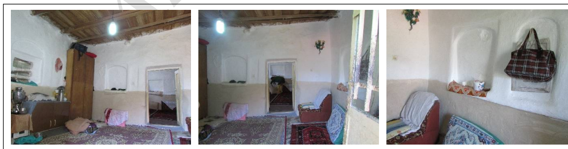
ت 4. تاقچه‌های دیواری کاربردی در یک اتاق چند عملکردی.

فضای بسته: فضاهای بسته در این منطقه شامل فضای نگهداری دام، فضای خدماتی و فضای زندگی (فضای عمومی و خصوصی) می‌باشد. فضای خصوصی فضایی است که پخت و پز در آن صورت می‌گیرد و اعضای خانواده در آنجا روز خود را سپری می‌کنند و محل زندگی، غذا خوردن و خواب آن‌ها است و با توجه به اینکه به دلیل شرایط مالی روستاییان امکان اتاق اختصاصی برای هر یک از اعضای خانواده امکان‌پذیر نیست طراحی داخل اتاق‌ها به گونه‌ای است که با قرار دادن تاقچه‌های متعدد برای لوازم کاربردی و گنجه‌های بزرگ درون دیوار برای لباس یا رختخواب و فضاهایی از این قبیل نیازهای آن‌ها را برطرف می‌کند و فضای عمومی فضایی است که کمتر مورد استفاده قرار می‌گیرد و از آن برای پذیرایی از مهمان که ورودی جداگانه‌ای دارد استفاده می‌شود (تصویر شماره 4).