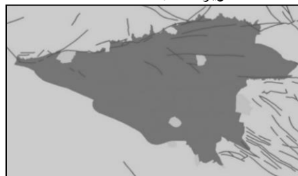
ت ۲. محلات مورد مطالعه (خاکستری پررنگ) و موقعیت گسل‌ها در شهر تهران، محلات حذف شده (خاکستری کمرنگ).

در ایران و در قانون تقسیمات کشوری، محله به‌عنوان مجموعه ساختمان‌های مسکونی و خدماتی تعریف شده است که ساکنان آن به لحاظ بافت اجتماعی، خود را اهل آن محل می‌دانند. حدود محله تابع تقسیمات شهرداری است (طرح جامع تهران، ۱۳۸۶). در پژوهش حاضر، محلات شهر تهران به‌عنوان محدوده مورد مطالعه جهت سنجش ارتباط فرم شهری و تاب‌آوری انتخاب شده است. با توجه به شاخص‌ها و داده‌های موجود (اطلاعات مرکز آمار ایران ۱۳۹۰)، شهرداری تهران (۱۳۹۰)، سازمان فناوری اطلاعات و ارتباطات شهرداری تهران (۱۳۹۲)، هفت محله تهران به دلیل شرایط خاص و نداشتن اطلاعات در اکثر شاخص‌ها حذف شدند (تصویر شماره ۲).